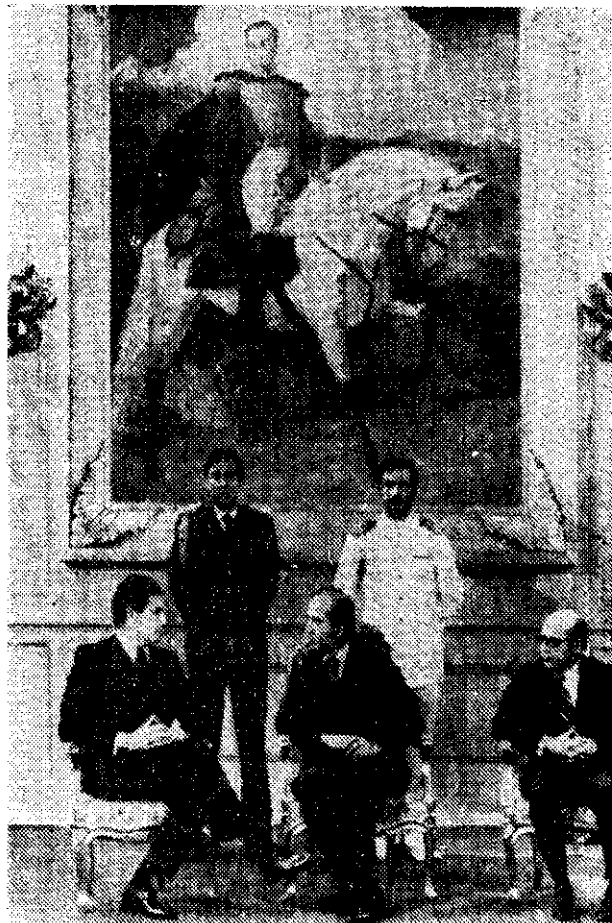
EL EMBAJADOR argentino en Caracas, Héctor Hidalgo Solá —izquierda—, supuestamente secuestrado en Buenos Aires, platica con el Presidente Carlos Andrés Pérez durante la presentación de sus cartas credenciales, el 19 de julio del año pasado.

En Rosario, a 300 kilómetros al norte, efectivos militares dieron muerte al conductor de un camión que embistió accidentalmente a un vehículo militar.