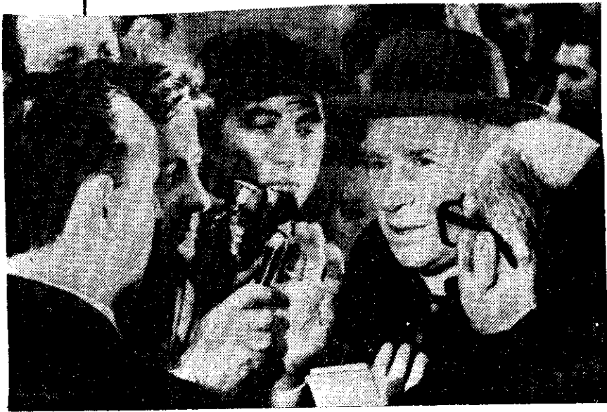
EL OBISPO disidente Marcel Lefebvre arribó ayer a Buenos Aires, en la tercera etapa de su gira privada por América Latina.