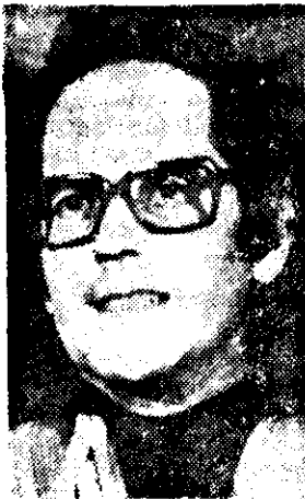
EL ARGENTINO Adolfo Pérez Esquivel, Premio Nobel de la Paz, calificó a la política de derechos humanos del Presidente Reagan de "un gran paso atrás" y acusó al gobierno de su país de ocultar la verdadera cifra de presos y disidentes políticos desaparecidos.