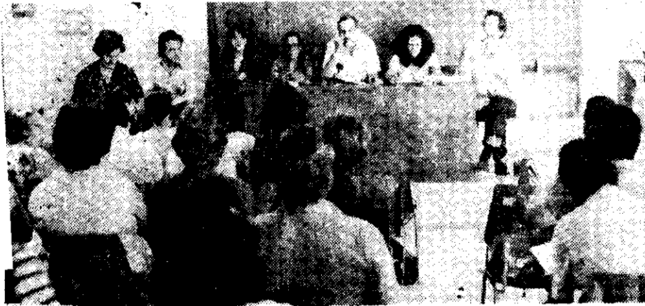
Los delegados, reunidos en el II Congreso, superarán las diferencias políticas, sociales y religiosas para constituir una Federación Latinoamericana de Familiares de Detenidos-Desaparecidos.

El II Congreso Latinoamericano de Familiares de Detenidos-Desaparecidos debate sobre la constitución de una federación que proteja y denuncie a nivel mundial las desapariciones en América Latina.