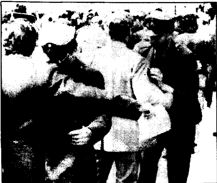
La defensa que la ONU hace sobre los derechos humanos atropellados tiene defensores y detractores, como Jeanne Kirkpatrick.

La otra cara de la moneda fue presentada en Francia por el obispo auxiliar de París, quien denunció las desapariciones de niños en Argentina. Narró casos específicos y dijo que "nadie, y sobre todo ninguna madre, puede soportar que familias enteras sean víctimas de tan crueles torturas psicológicas".