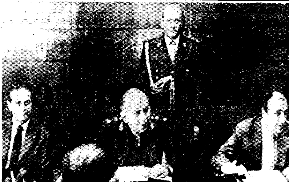
Buenos Aires. El presidente interino Horacio Liendo, al centro, preside una reunión de gabinete. A su izquierda, el ministro de economía Lorenzo Sigaut y a su derecha Amadeo Frugoli, ministro de Justicia.