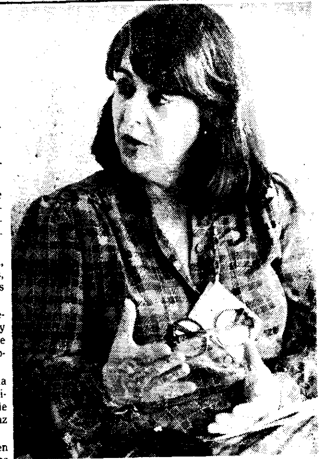
La viuda del asesinado Orlando Letelier no cesa de denunciar la represión de la dictadura de Pinochet.

El sábado irá tranquila a visitar la tumba de su esposo en el Cementerio del Este. Allí podrá estar sola y compartir los recuerdos familiares, de cuando los dos bajo un sistema de libertad