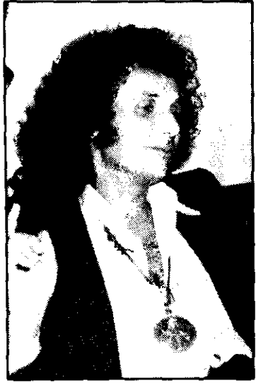
Mercedes Sosa, Juan Manuel Serrat y Roberto Carlos: silenciados.

El sistema para impedir que las canciones se escuchen por las radiodifusoras o televisoras es muy simple. "El método es contundente —explica uno de esos trabajadores de la radio— si pasamos un tema equivocado y ellos escuchan, a las pocas horas recibimos una comunicación para presentarnos a declarar y, lógico, recibir la multa".