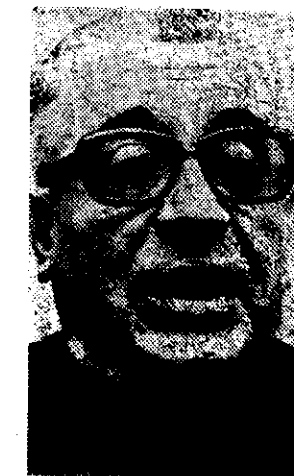
EL OBISPO Antonio Quarracino, de Argentina, fue elegido anteayer presidente de la Conferencia Episcopal Latinoamericana (CELAM) durante una reunión en Puerto Príncipe, Haití.

Además, se decidió la creación de poderosas radio-difusoras católicas regionales—por grupos de países— para cubrir América Latina y el Caribe, a fin de oponerse a las sectas y mantener un ambiente de evangelización.