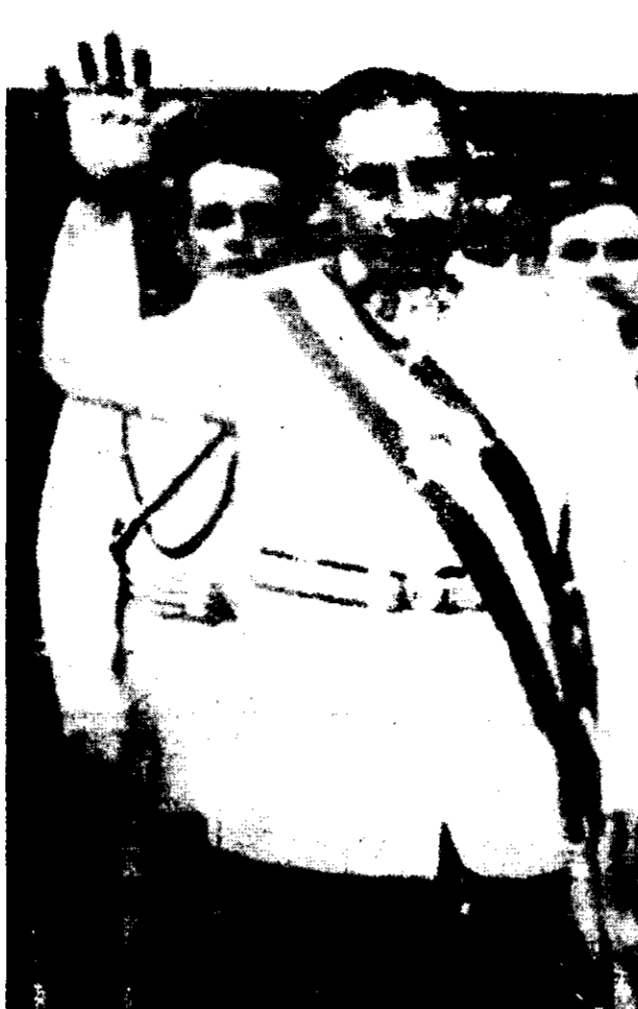
LAS CASTAS MILITARES, constituidas ya en poderes para sí, ¿aceptarán volver a los cuarteles después de haber gozado durante lustros los privilegios y goces de los palacios de gobierno?

Los gases, balas y garrotazos retornaron a la Plaza de Mayo al cumplirse la primera quincena de aquel trágico junio en que las fuerzas armadas argentinas se rindieron ante las británicas; pero su ruido equivalió a una marcha de despedida de la facción militar "quedantista" la que se resistía al regreso a los cuarteles. Si Galtieri se hubiese salido con la suya, Argentina tendría a sus militares en el poder más allá del año 2000. Con su derrota, no les quedó otra salida, a los administradores del desastre que eran además sus albaceas, replegarse en orden y