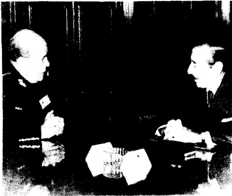
El secretario de Defensa mexicano, general Félix Galván López, y el jefe de la junta militar argentina, Jorge Rafael Videla, se entrevistaron ayer en Buenos Aires.