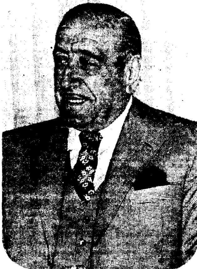
HECTOR J. CAMPORA

El rotativo estimaba que quizá el caso, no resuelto en los niveles diplomáticos normales, pese a la reiterada insistencia de México, sea solucionado entre militares, pero esto parece descartado por las declaraciones de Videla.