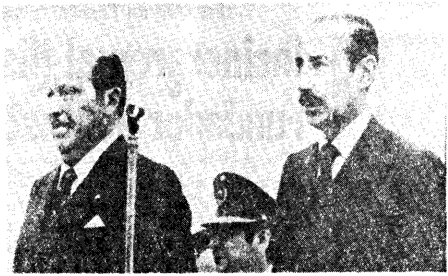
LOS PRESIDENTES de Paraguay, Alfredo Stroessner y de Argentina, general Jorge Rafael Videla, se reunieron ayer en Salta, para charlar sobre temas bilaterales.