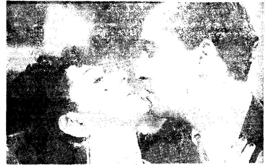
Sara Guash y Hugo del Carril