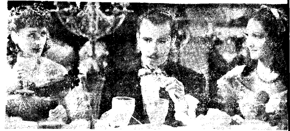
Hugo del Carril en "La novela de un joven pobre"