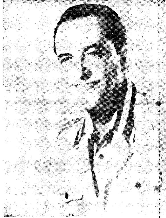
En el Teatro de la Ciudad, Hugo del Carril

"Esto se debe a una infinidad de factores. Uno: la música moderna apoya y da por las compañías grabadoras de discos, a las cuales yo no culpo, ellos hacen su negocio, pero insisto, el