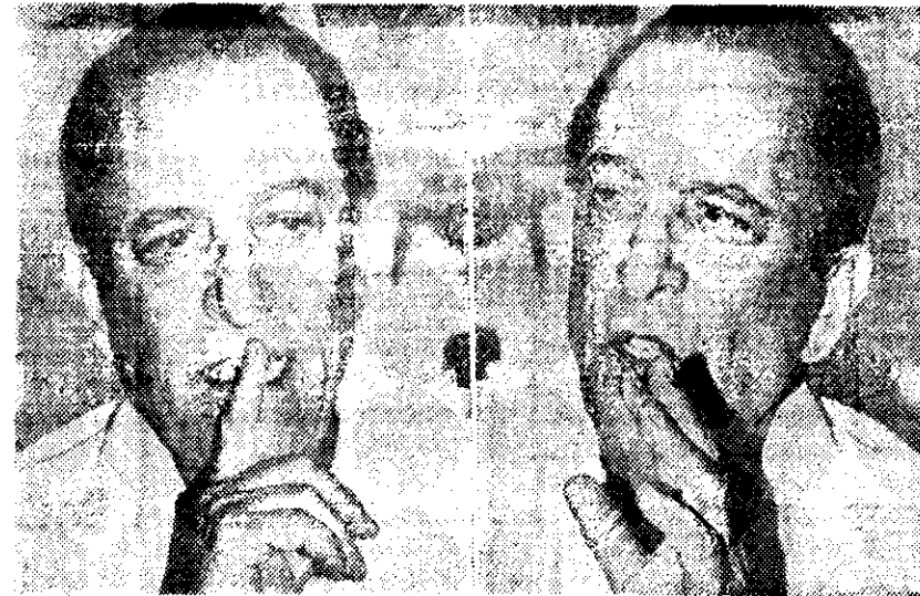
Durante la entrevista.