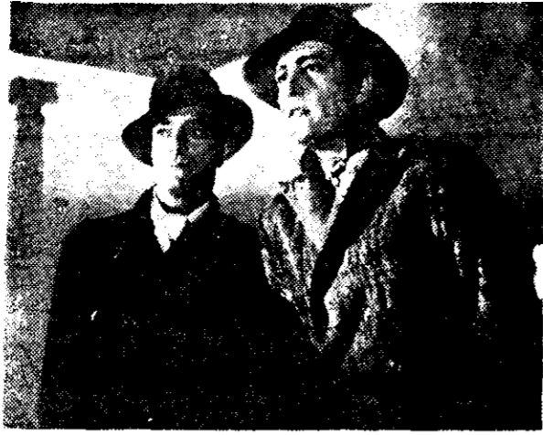
Del Carril, en una película