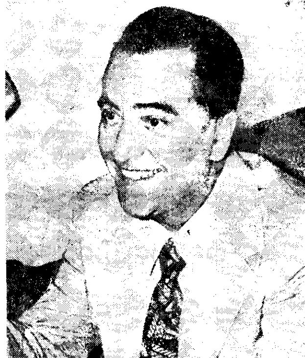
El cantante argentino