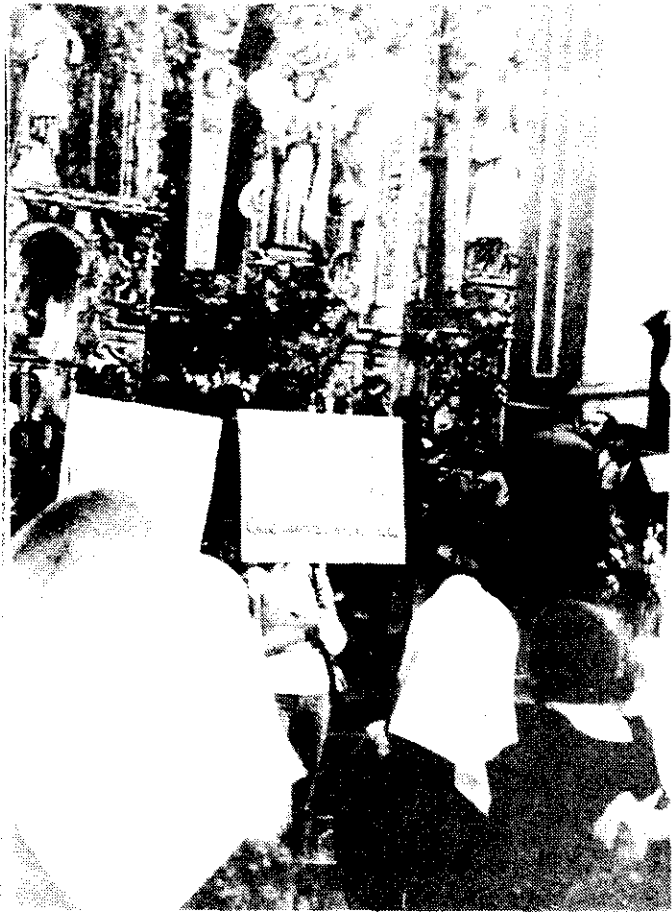
Numerosas refugiadas argentinas en el templo de San Cosme y San Damián se ataviaron ayer como las Madres de Plaza de Mayo al concluir una jornada de ayuno para exigir la presentación de 20 mil desaparecidos en su país. (Foto, Ricardo Monroy).

ce en Argentina. Al término del acto, los carteles colocados en el atrio del templo volvieron a su lugar, en los rincones inéditos, y quienes no habían probado alimentos desde el jueves regresaron a tomar la última tacita de agua con azúcar y limón antes de rebanar el pan.