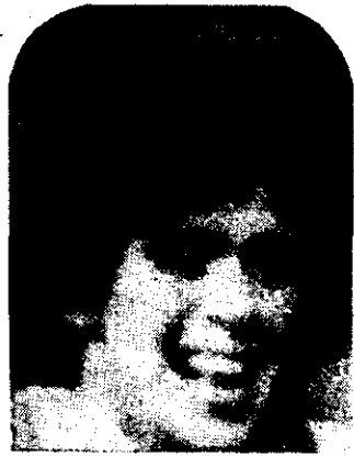
MARADONA y su equipo fueron causantes de la fiesta argentina.

Se presumía que los festejos proseguirían hasta avanzada la noche a pesar de ser día laborable.