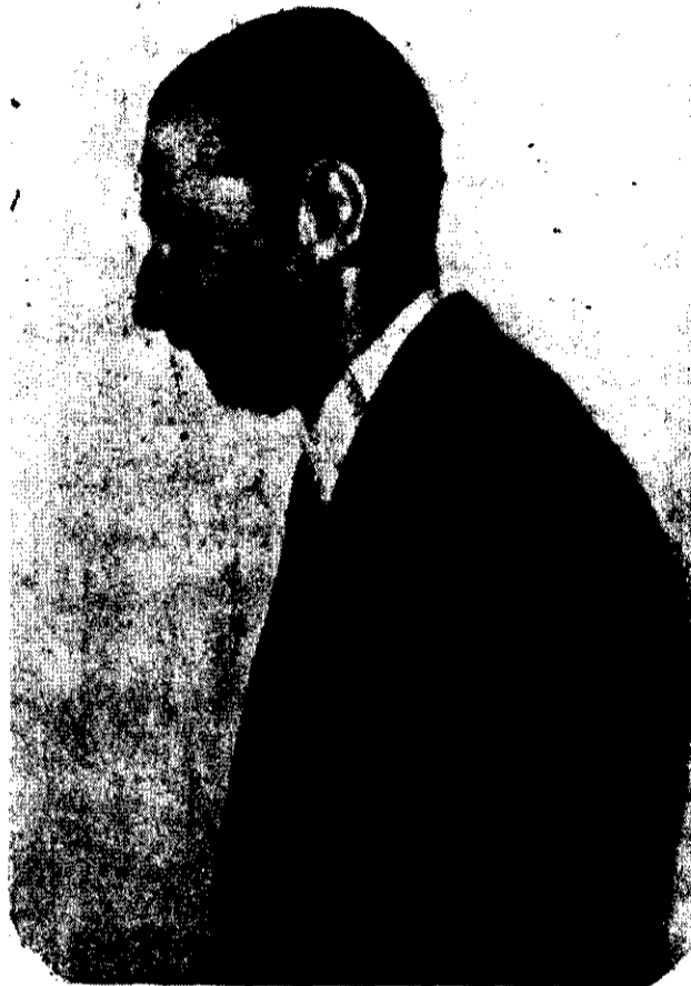
JORGE RAFAEL VIDELA

Dijo luego que Estados Unidos tiene una imagen distorsionada de la Argentina, "ya que durante 2 siglos ha vivido un régimen constitucional ininterrumpido".