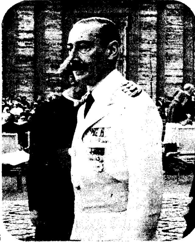
JORGE VIDELA: hay tensión en su gobierno, con motivo de la próxima visita de la CIDH....

ARTICULO 6º - Transcurridos NOVENTA días contados desde la última publicación de los edictos, lapso durante el cual el Juez requerirá de oficio información del Ministerio del