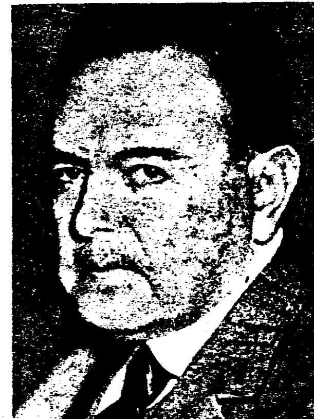
HIPOLITO IRIGOYEN, presidente de la República Argentina, que ordenó al crucero "9 de Julio" saludar la insignia patria del pueblo dominicano.

"El barco argentino, al entrar al puerto izó al tope la bandera del país hollado, saludándola con una salva. Se corrió la voz en la ciudad. Gentes fervorosas compusieron con trozos de tela una bandera dominicana que izaron en el torreón de la fortaleza, y veintiún cañonazos de la nave argentina tributaron el saludo de la independencia al pabellón nacional de Santo Domingo y no a la bandera estadounidense, es decir, la del país extranjero que flameaba en la casa de gobierno. La multitud se lanzó a las calles y una gran manifestación