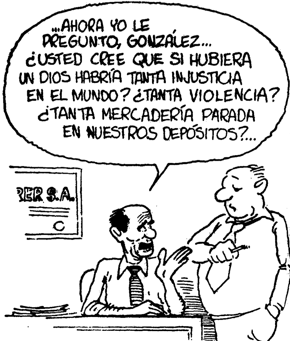
CARICATURA DE Clarín de Buenos Aires, que vale por varios editoriales, reveladora de la "rentabilidad negativa" de un vasto sector de la burguesía comercial e industrial argentina.

Las diferencias y coincidencias son cada vez más marcadas en las páginas de Clarín y se expresan por lo habitual con el lenguaje especializado de la economía y las finanzas. Un ejemplo reciente lo provee un análisis de su suplemento económico titulado "Escasa rentabilidad de la empresa nacional" (Clarín, 16 de diciembre de 1979, pp. 8-9), cuyo lead sentencia: "La caída experimentada en los últimos años en los niveles de rentabilidad de las empresas está vinculada a un esquema de corte recesivo. También tiene que ver con la obsolescencia de muchas actividades pro-