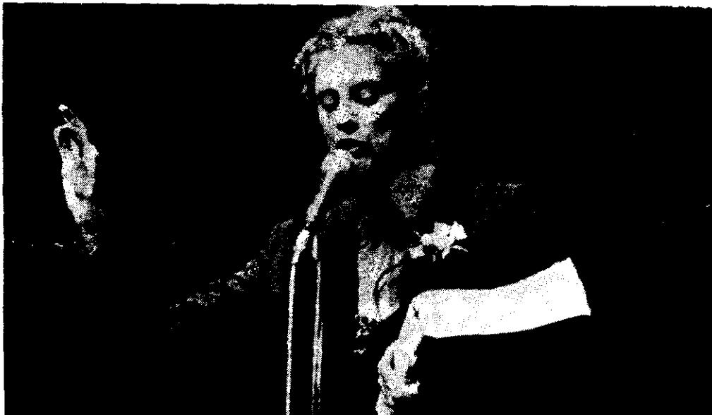
Nacha Guevara en el momento de dar su célebre curso de lectura punteada.

Para más, debe tomarse en cuenta que Nacha se presentó cantando en español.