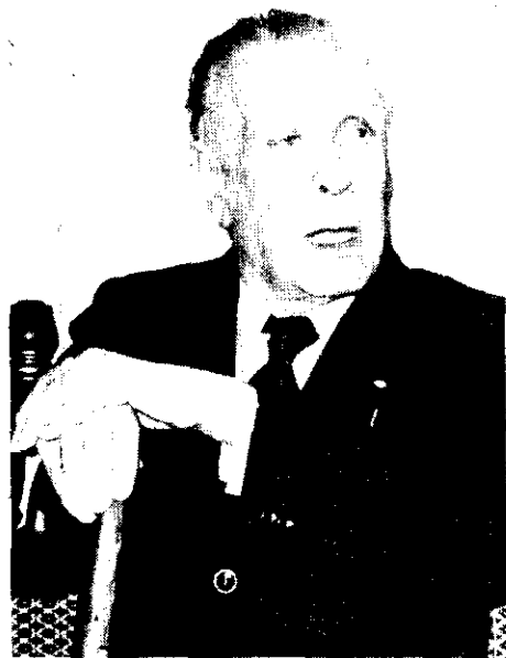
Jorge Luis Borges