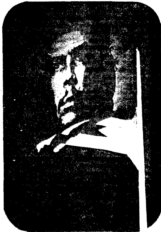
LA BANDERA CUBANA a media asta, en la celebración de un homenaje al "Che".

Todo ello porque era capaz, como le pedía a sus hijos que lo fueran, "de sentir en lo más hondo cualquier injusticia cometida contra cualquiera en cualquier parte del mundo"; porque era ese hombre verdadero que, al decir de