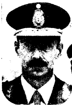
GENERAL JORGE VIDELA

pón con una visita a la Gran Muestra de la Producción Argentina. Durante su presencia, en la muestra, 7 miembros de la sec-