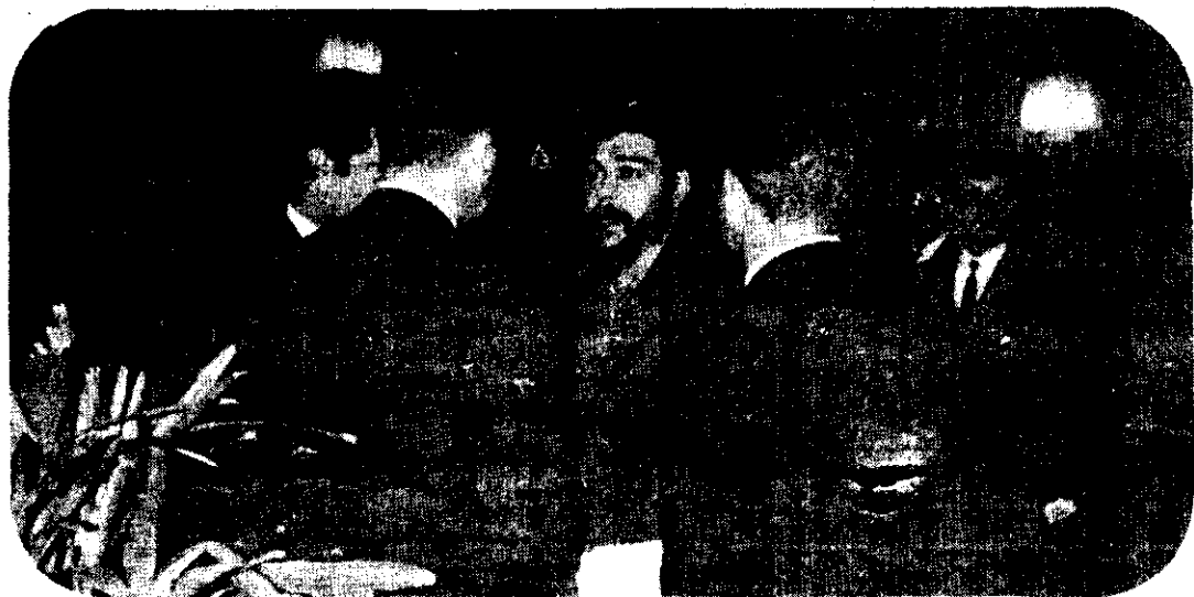
CONVERSANDO CON delegados a la reunión del CIES, en Punta del Este, Uruguay, agosto de 1961.

Esto también lo enseñó el comandante que "al entrar en la aurora/dejó a todos los pueblos como herencia su vida", y de quien proclamara Fidel Castro que "nunca podrá hablarse en pasado".