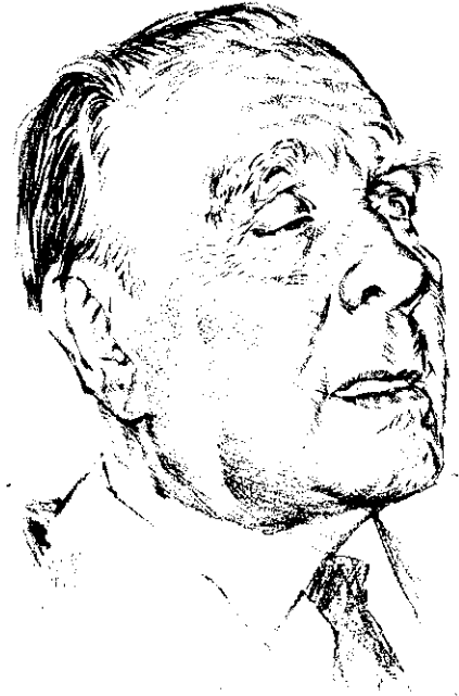
Jorge Luis Borges habló de Shakespeare