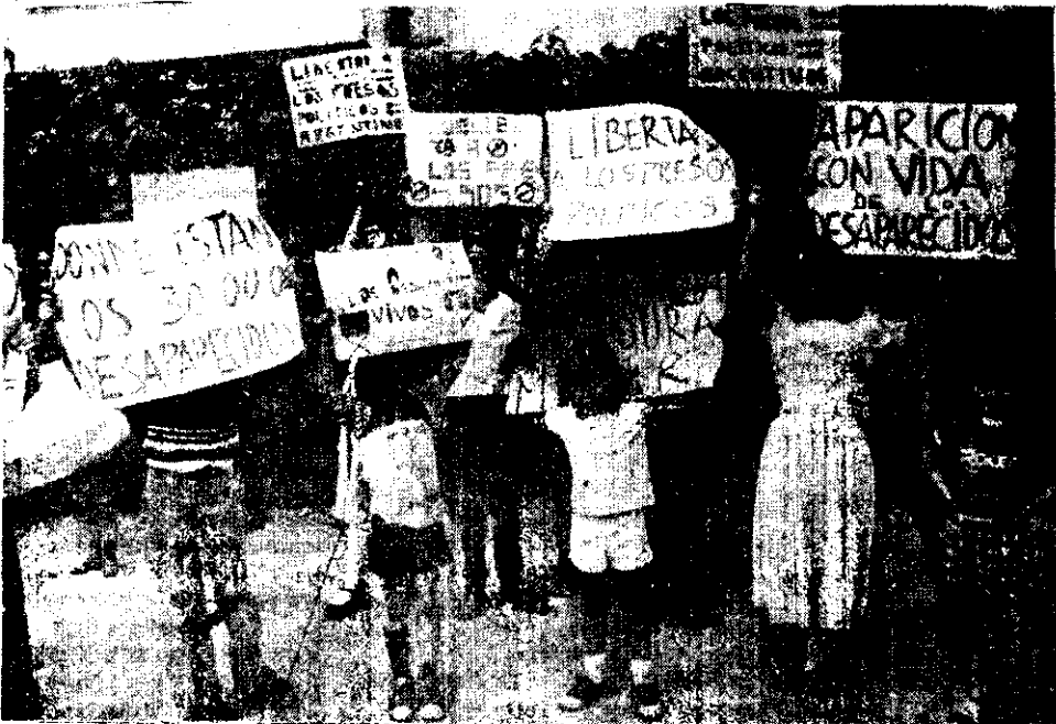
FRENTE A LA EMBAJADA Argentina en México se manifestaron ayer asilados de esa nacionalidad aquí, y también sus hijos, quienes reclamaron por la aparición con vida de los desaparecidos en ese país sudamericano.

Finalmente, antes de disgregarse, los manifestantes entonaron el himno de su país y reiteraron su agradecimiento a los mexicanos por el asilo brindado.