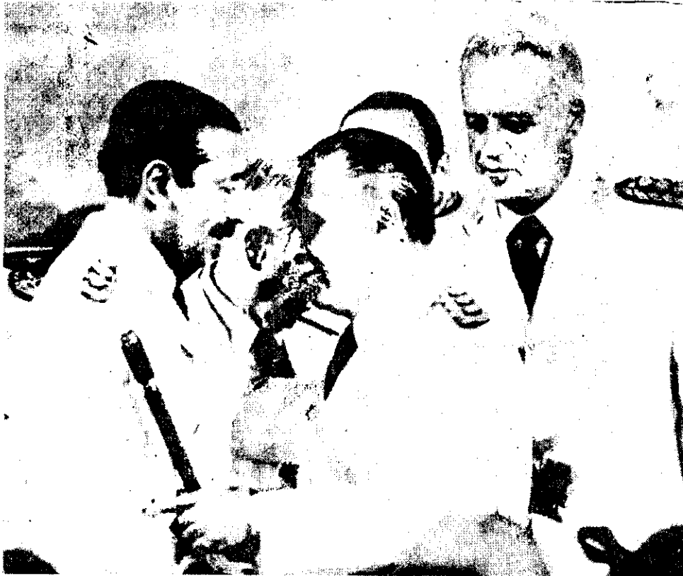
EL HASTA AYER presidente de Argentina, Jorge Videla (izquierda), felicita al nuevo mandatario, designado por su propio gobierno, Roberto Viola.

Solamente el matutino Convicción ligado al gobierno militar como vocero de las opiniones de la Armada de Guerra, concede su única foto de tapa al nuevo presidente.