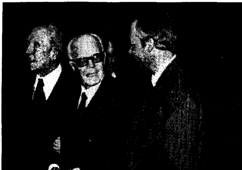
JORGE LUIS Borges, el Presidente italiano Sandro Pertini, y el matemático Enrico Bombleri, durante la entrega del Premio Balzan 1980, recientemente en Roma. El escritor argentino retornó ya a su país.