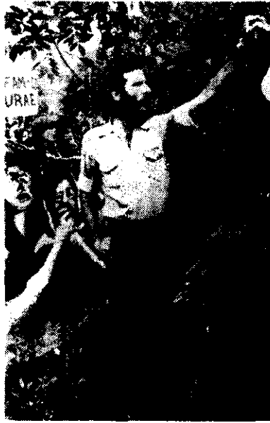
Exiliados argentinos en México realizaron ayer una manifestación frente a la embajada de su país, para protestar por la toma de posesión del general Roberto Viola como presidente. (Foto de Marta Zarak). 5