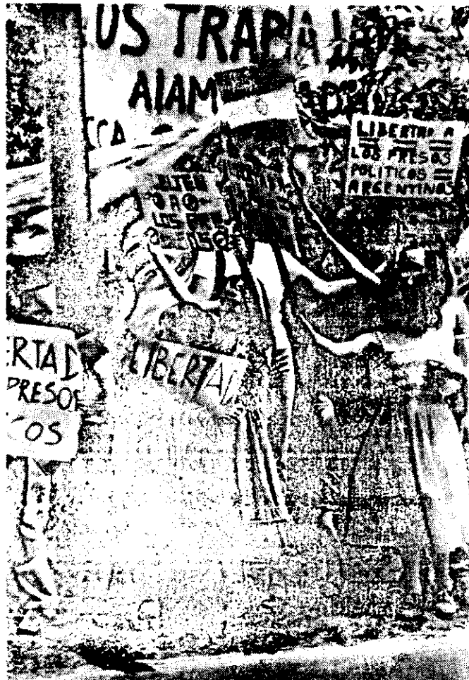
Niños y adolescentes participaron en la manifestación de exiliados argentinos. (Martha Zarak)

Como ese permiso fue denegado, los asistentes realizaron una conferencia de prensa donde denunciaron el problema de los desaparecidos y de la violación de los derechos humanos y civiles.