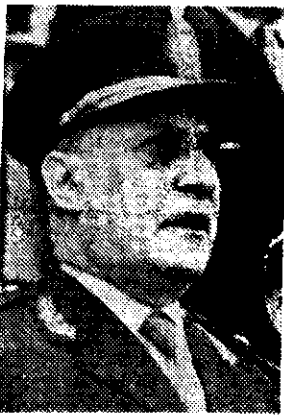
GENERAL Roberto E. Viola, Presidente de Argentina.