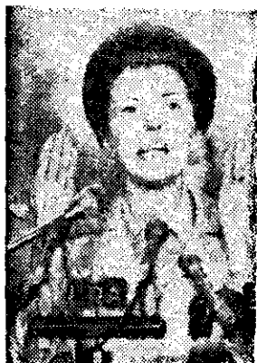
María Estela de Perón

Pero el hecho de que ya no tiene allí su domicilio es tan notorio que el juez se ha resistido a admitir la ficción legal, y habría dispuesto intimarla para que constituyera un nuevo domicilio en la Capital Federal y designara un apoderado que la represente. Para notificarle esa decisión, el funcionario encargado del trámite habría debido requerir previamente la correspondiente autorización a la autoridad militar responsable de la seguridad de la ex jefe del Estado que, como es sabido, se aloja en la residencia Messidor, del Gobierno del Neuquén,