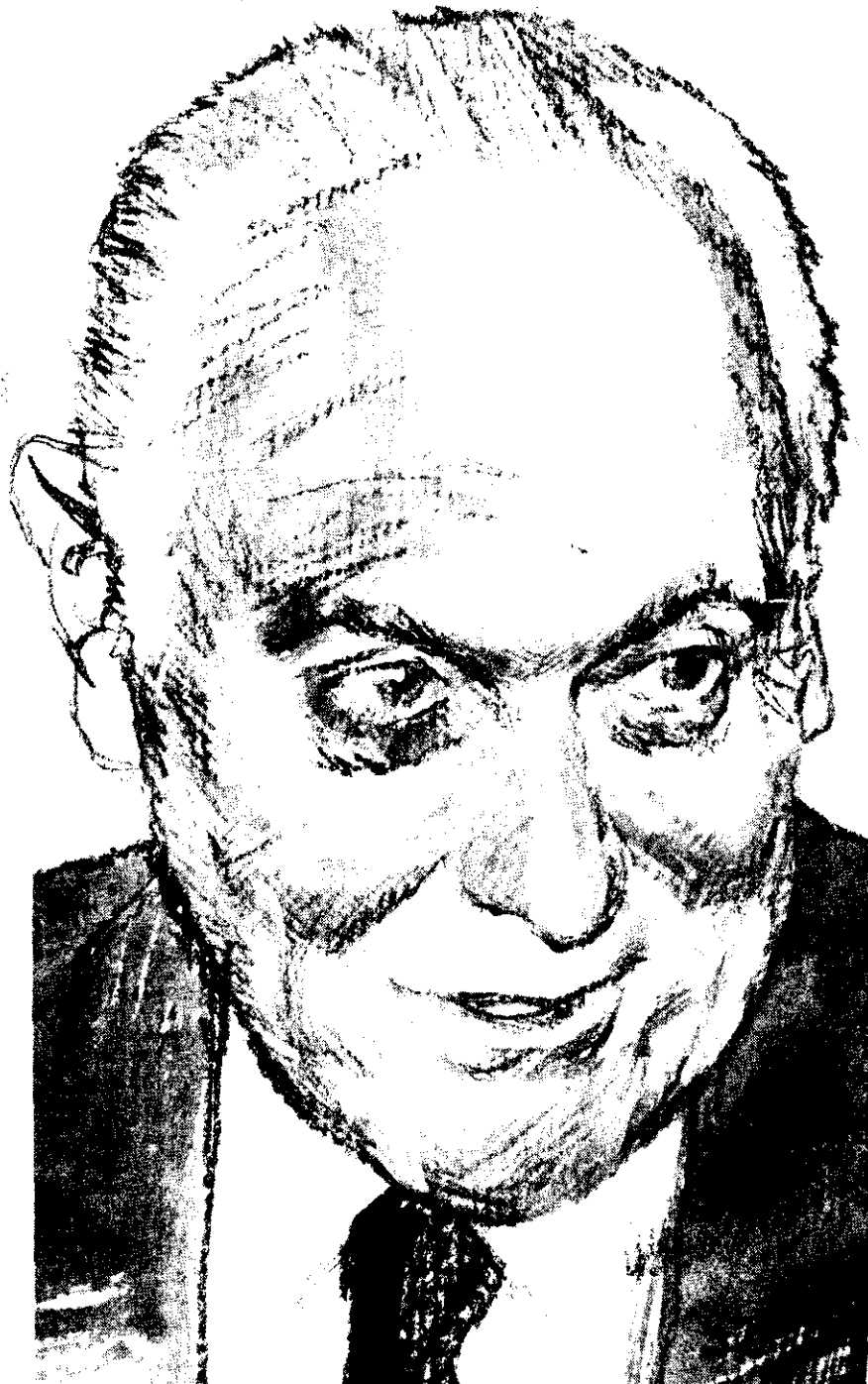
General Alejandro Lanusse

En el renglón habitual de las detenciones, arbitrarias o no, y de los secuestros, por la policía o la oposición, hubo que registrar en la semana el secuestro del corresponsal de Canal 13 TV, de México, sobre cuyo paradero se tienen serios temores, y que ha dado lugar a una serie de protestas por los medios de prensa del continente.