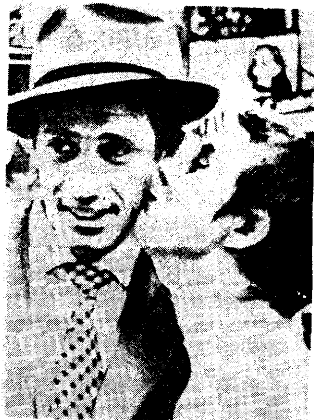
ESCENA de la obra "Sin Aliento"