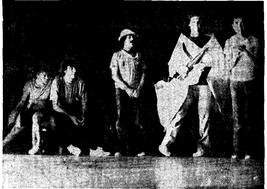
EN LA OBRA "Los Juegos"