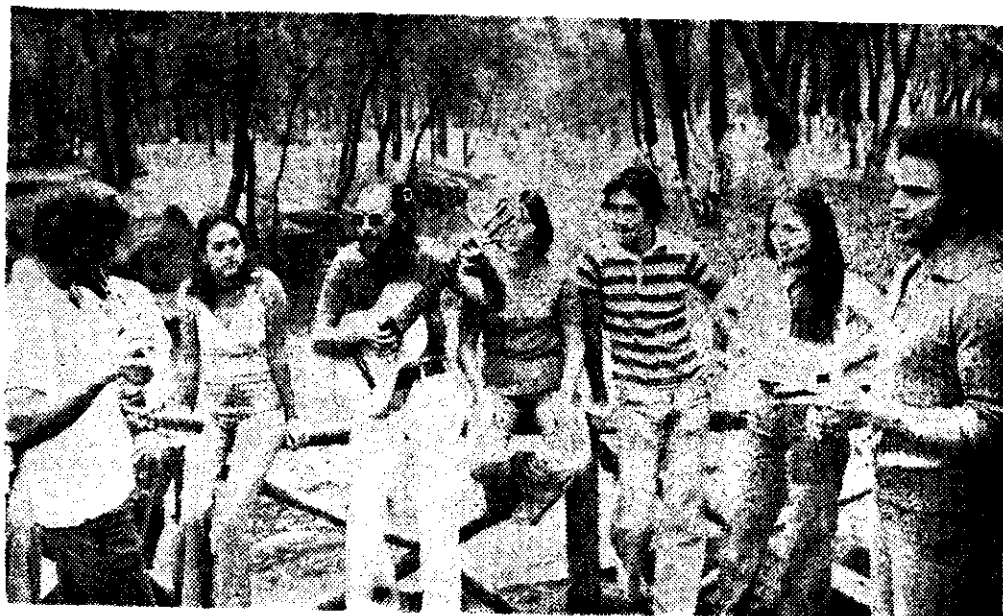
EL GRUPO en Xochimilco