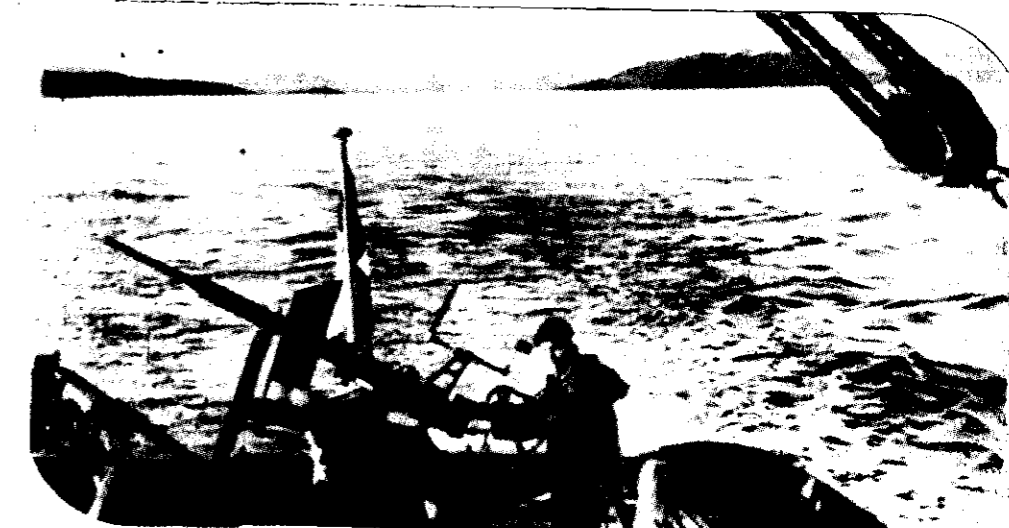
UN MARINERO EMPUÑA un arma pesada a bordo de un buque de la Marina de Guerra chilena que patrulla el Canal de Beagle entre Argentina y Chile.

Orbe informó que en el lugar de la reunión había un mapa de la zona austral "ubicado en forma destacada".