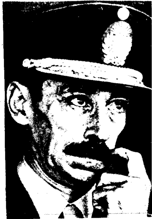
Jorge Rafael Videla

Videla reaccionó con presteza y al poner la investigación oficialmente en manos del Ejército, lo que parece haber neutralizado el riesgo de desbordes arbitrarios en la indignación o que sus resultados sean empleados con ulteriores fines políticos. “Es un escándalo demasiado grande. La madeja de intereses del mundo de los negocios es tan enmarañada, que una investigación a fondo podría poner en peligro al propio sistema económico”, afirmó un banquero, en cuanto a que la indagación se lleve hasta sus últimas consecuencias.