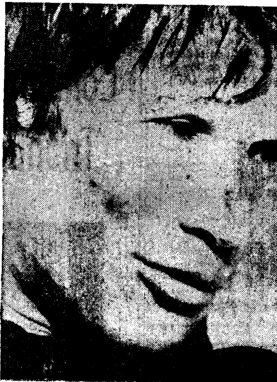
CARLOS MONZON—Culpable. Perderá la patria potestad de sus tres hijos.

Beatriz García solicitó la separación y división de los bienes el año pasado, luego de que el actual campeón del mundo iniciara relaciones amorosas con la actriz-vedette argentina Susana Giménez.