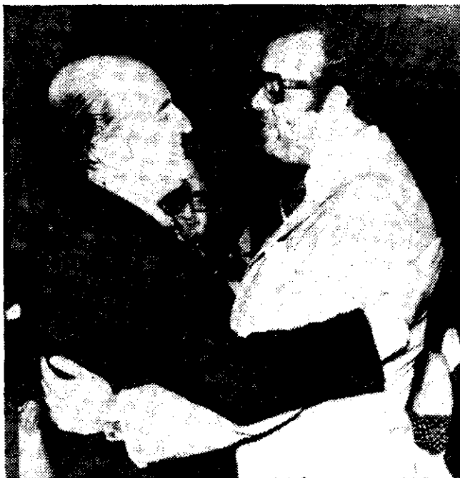
El embajador argentino Alejandro Orfila (izquierda) recibe las felicitaciones de su más cercano oponente, Víctor Gómez Berges, canciller dominicano, tras anunciarse su triunfo como secretario general de la Organización de Estados Americanos.

Este en las dos votaciones tuvo 9 votos a su favor, contra 12 de Orfila pero en la primera, tres países se abstuvieron y fue necesario pasar a una segunda votación; en ella, uno de los abstencionistas votó en favor de Orfila, para acabar con el estancamiento a que se había llegado desde el miércoles pasado.