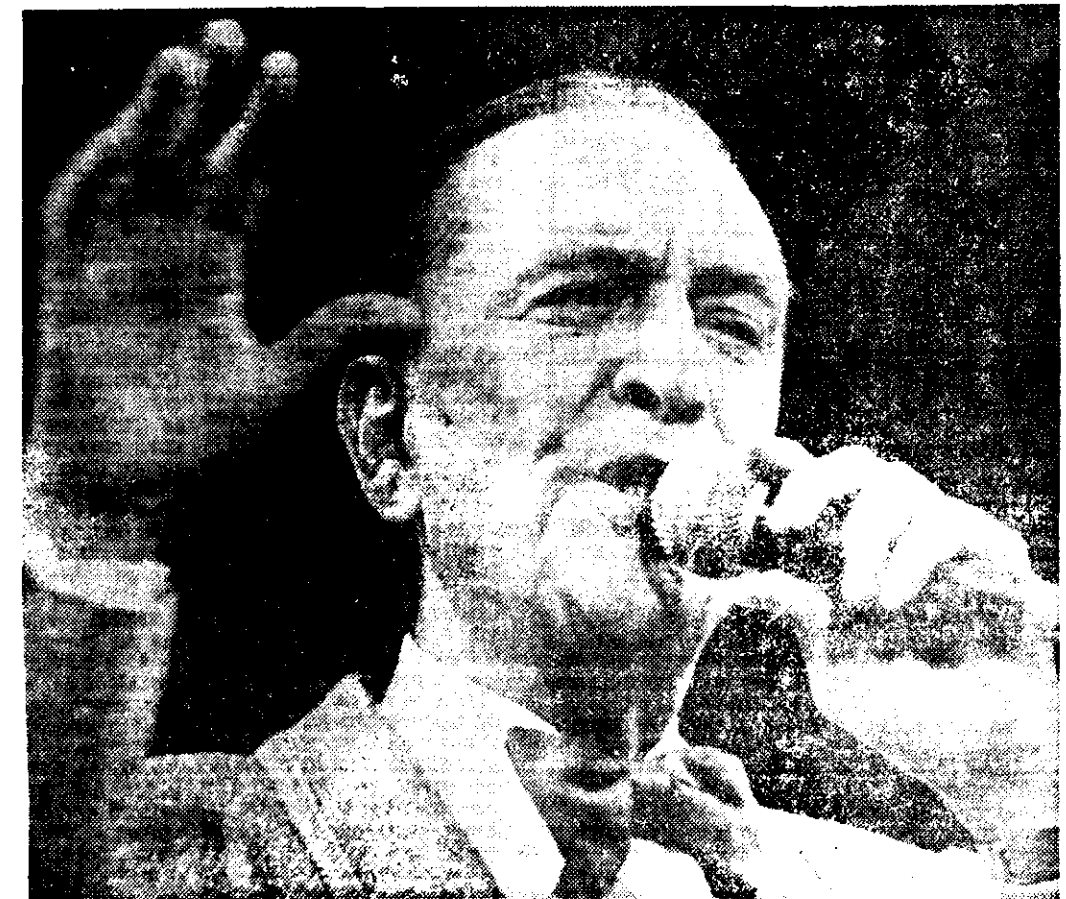
Hugo del Carril