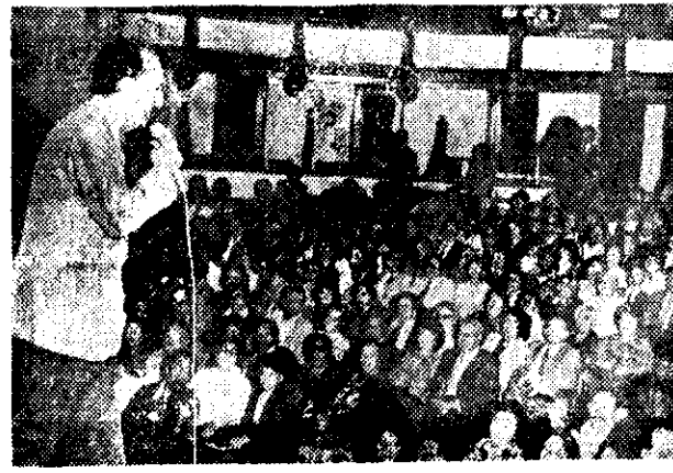
Durante su actuación

—Entre la atención del vivero con todas las experiencias que se van logrando y continuar el ritmo comercial de éste, seguir la administración general de