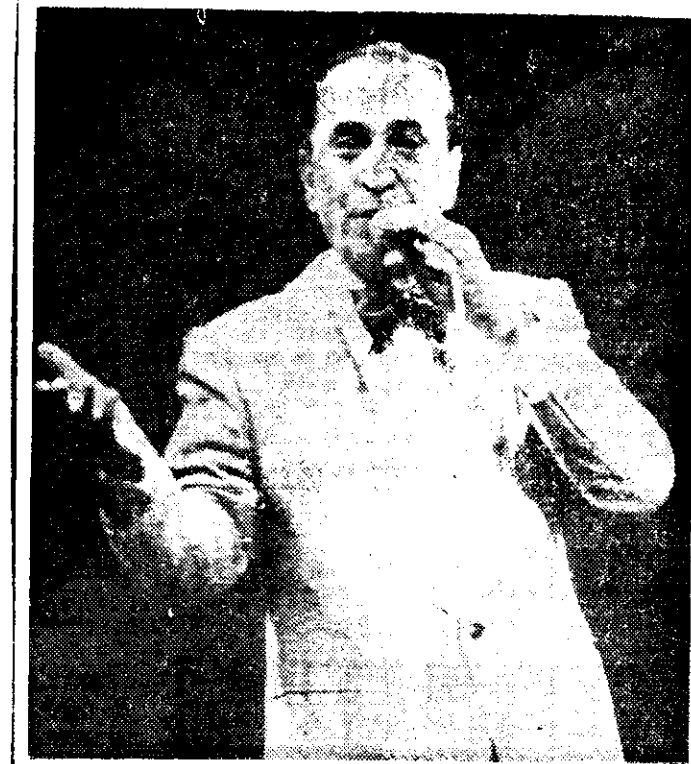
En el concierto