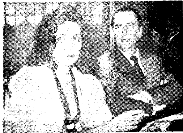
El cantante con su esposa