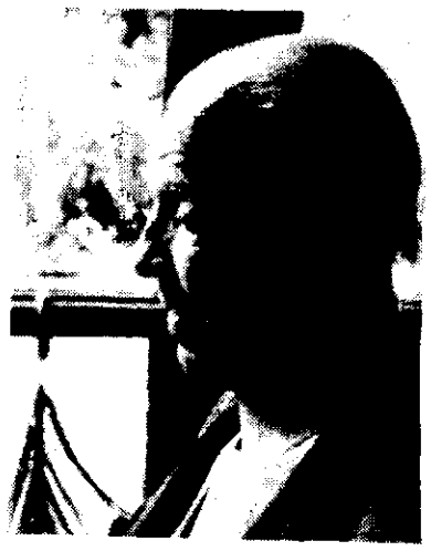
Jorge Luis Borges se definió ayer como "un hombre ideológicamente pobre", pero antes de viajar hacia Morelia. 17