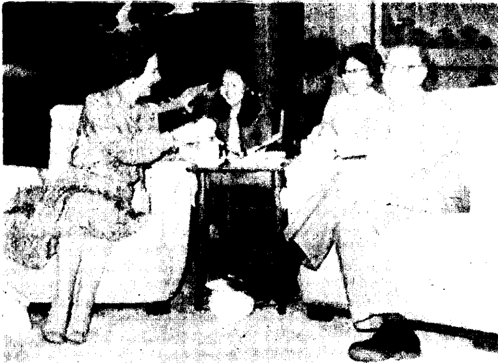
LA PRIMERA ministra británica, Margaret Thatcher, llegó ayer a Pekín y se entrevistó con su colega Zhao Ziyang, con quien compartió la tradicional agua de hojas de China.