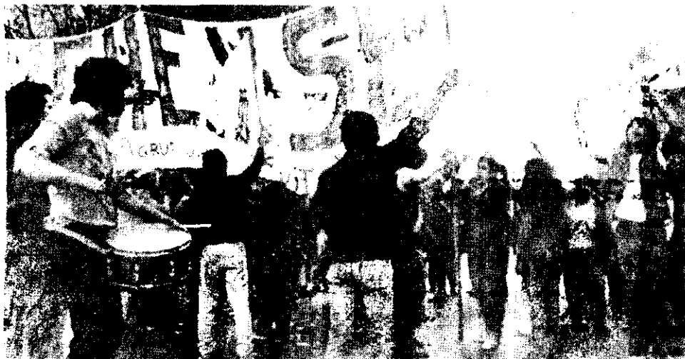
PAZ, PAN Y TRABAJO, CONSIGNA levantada junto a "Se va acabar la dictadura militar", por miles de manifestantes en la Plaza de Mayo de Buenos Aires, el miércoles convocados por la CGT-Brasil.

Como todos los miércoles, las madres realizaron su acostumbrado acto en la plaza San Martín, frente a la casa de gobierno de la provincia de Buenos Aires, en demanda de la aparición con vida de los detenidos desaparecidos durante la guerra de los años 1976-79.