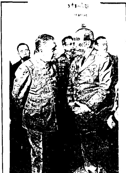
LOS DOS COMPARTES Pinochet y Stroessner.

Después de reseñar los datos glosados precedentemente, La Nación puntualizaba que la