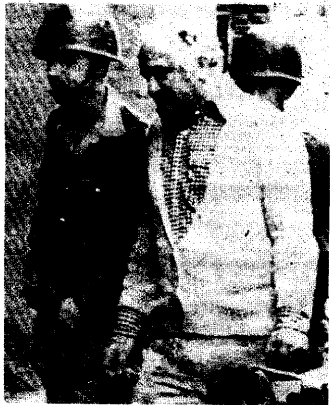
EL EMPRESARIO periodístico argentino Jacobo Timerman es llevado custodiado por soldados al aeropuerto de Buenos Aires, luego de que el gobierno lo expulsó del país y le quitó su ciudadanía, tras 2 años y medio de detención.

Los trabajadores anunciaron que lanzarían un llamado a la mediación de las autoridades eclesiásticas y de la embajada de Francia. Esta última declaró que hasta mediodía no había recibido ningún mensaje en tal sentido.