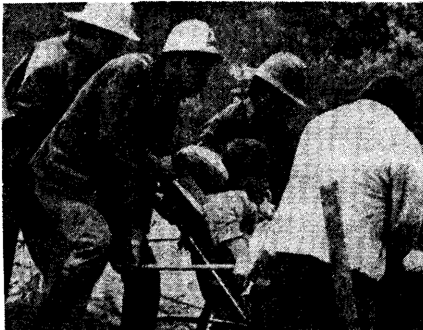
EL SECRETARIO de Programación y Coordinación Económica de Argentina, Guillermo Walter Klein, es retirado ileso por varios bomberos, de las ruinas de su residencia, ayer, en Buenos Aires, después de que la casa fue ametrallada y dinamitada por terroristas. Dos guardaespaldas del funcionario murieron.