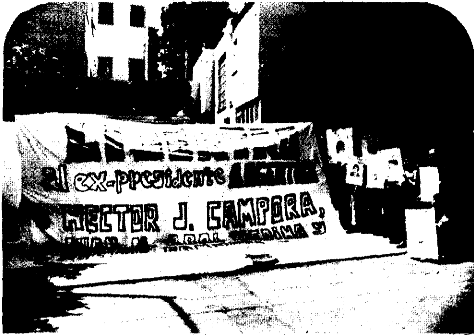
EL APOYO internacional de todas las organizaciones políticas pidió ayer el Cosofam para el salvoconducto al ex presidente argentino J. Cámpora, su hijo, y Abel Medina, asilados en la embajada mexicana de Argentina desde 1976.

La libertad del ex presidente argentino Héctor J. Cámpora, su hijo y Juan Manuel Abal Medina, pidió ayer frente a la embajada de Argentina en México, el Comité de Solidaridad de Familiares de Presos Muertos y Desaparecidos en ese país, COSOFAM.