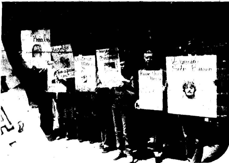
ANTE la Embajada de Argentina en México se efectuó un mitin en el que se repudió, entre otras cosas, la ley que declara muertos a los desaparecidos en aquel país. (Foto MAYO).

Fideler el apoyo internacional de todas las organizaciones políticas, sindicales y de derechos humanos para ejercer presión ante el gobierno de Argentina para una pronta solución a este conflicto.