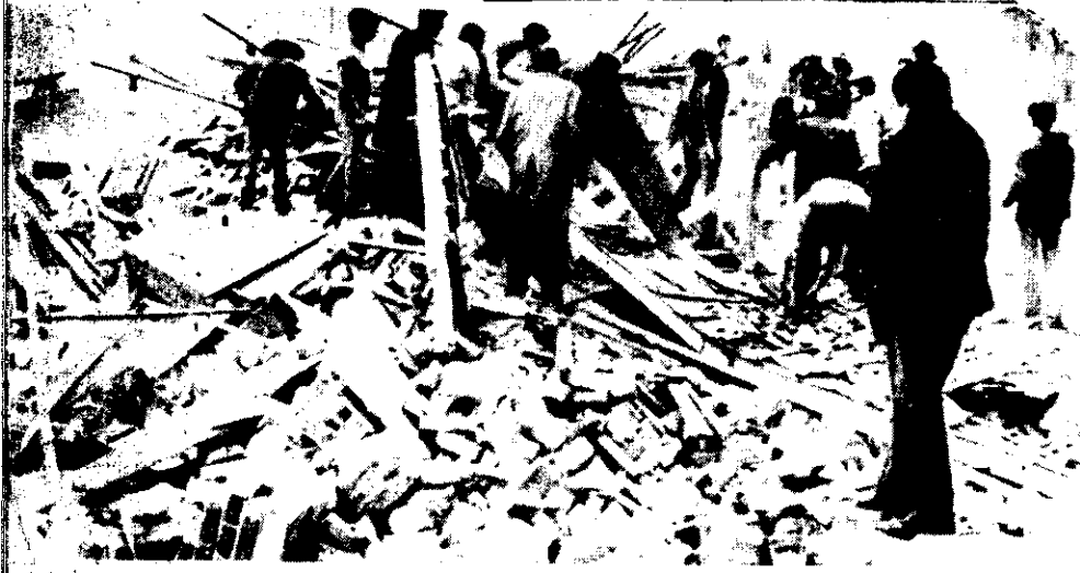
BOMBEROS remueven los escombros de la casa del secretario de Programación y Coordinación Económica, Guillermo Walter Klein. La casa fue dinamitada por un comando guerrillero. Klein sufrió heridas leves, al igual que su familia.

BUENOS AIRES, 27 de septiembre.—Dos custodios del secretario de Programación y Coordinación Económica de Argentina, Guillermo Walter Klein, murieron hoy a balazos en un enfrentamiento con un comando armado, que posteriormente dinamitó la casa del funcionario, quien resultó herido, así como su esposa y 4 hijos.