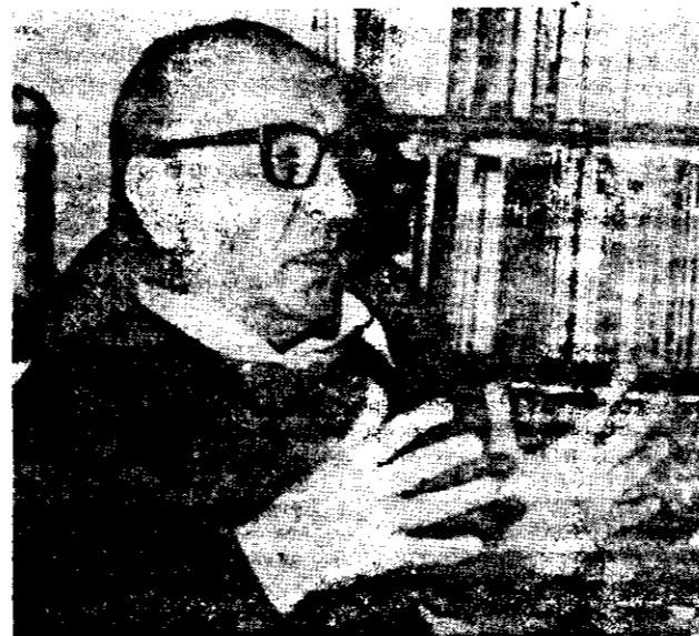
DOCTOR JORGE SABATO, científico mundialmente reconocido, "ninguneado" en su patria. Otros centenares de académicos de su nivel, que no soportan la conspiración de los mediocres, optan por emigrar.

técnicos, artistas, trabajadores de las más diversas especialidades, que constituyen el capital fundamental de la Nación y esto no parece haberle quitado el sueño a nadie. Más aún, no es raro escuchar expresiones tales como: 'Si lo dejan ir será porque no sirve', o 'Debe ser un comunista, mejor que se vaya', o 'Lo que pasa es que no quieren al país', que ya supone algo más que indiferencia".