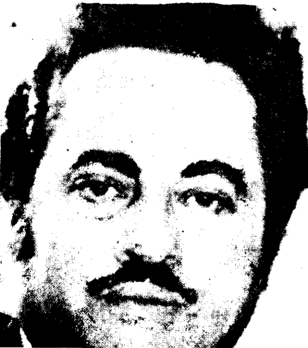
CANCILLER Edgardo Paz Barnica. Su tarea —aseguran las FPR— consiste en justificar lo injustificable.

—Primero desearíamos explicar algunas cuestiones. En nuestro país, el consumo de calorías solamente alcanza el 60 por ciento de los requisitos mínimos, y el consumo de proteínas sólo el 50 por ciento recomendado. En 1975 únicamente el 27 por ciento de los niños menores de 5 años podían clasificarse como "normales" y el resto presentaba diversos grados de desnutrición. Del total de la población económicamente activa económicamente activa, sólo el 9 por ciento tiene derecho a seguridad social. La esperanza de vida de los hondureños al nacer es de 52 años.