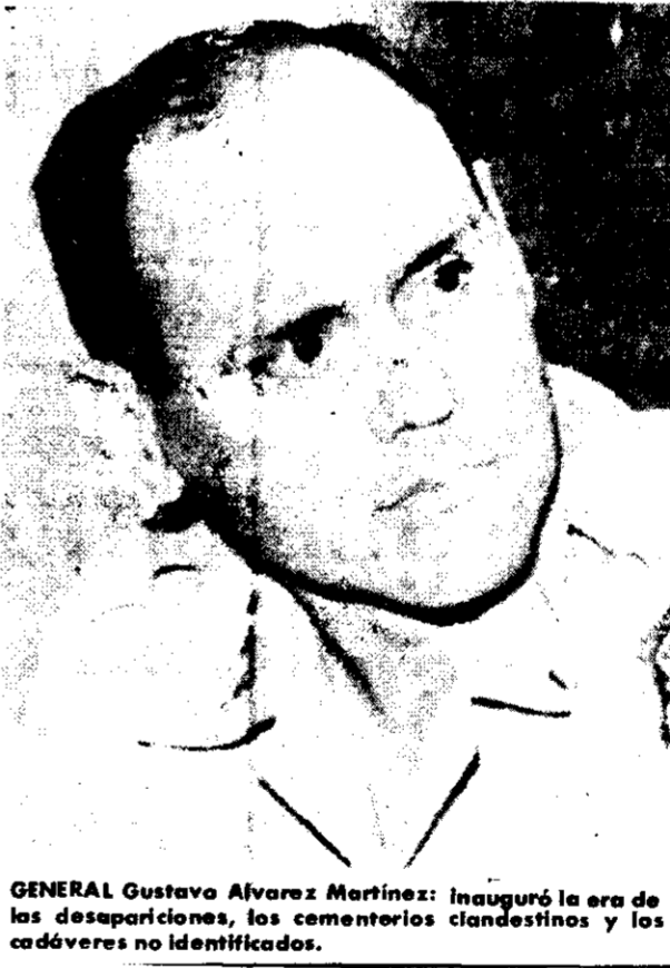
GENERAL Gustavo Álvarez Martínez: inauguró la era de las desapariciones, los cementerios clandestinos y los cadáveres no identificados.

—En efecto. En 1980 se comienza a mencionar la presencia de militares argentinos en Honduras. Varios presos políticos que son torturados creen reconocer, bajo la capucha, un acento rioplatense sudamericano que empieza a recibir anónimos y llamadas telefónicas con amenazas de muerte. Paralelamente, se producen secuestros, desapariciones. Y luego se descubren los cementerios clandestinos. Honduras tiene su historia de violencia, pero es una violencia de signo distinto. Esto, en