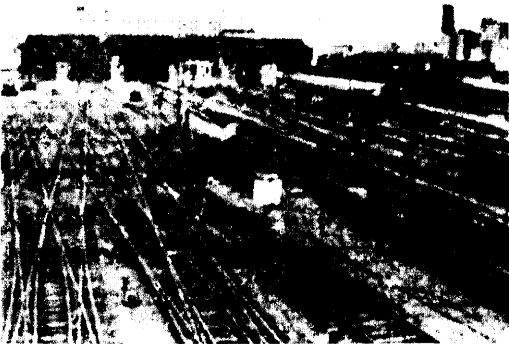
ESTACION FERROVIARIA de Constitución, en Buenos Aires, desierta el lunes a consecuencia de la huelga general de 24 horas en que participaron 9 millones de trabajadores de la República Argentina.

El pueblo argentino brega encarnizadamente por acompañar su situación a la de sus vecinos (y limítrofe del Cono Sur, en los cuales se está dando pasos significativos para reconquistar y consolidar la democracia. Nos referimos a la victoria arrolladora de la oposición democrática en Brasil (ahora sabemos que ganó 83 de las 100 mayores ciudades de ese país), al acceso de la UDP al gobierno de Bolivia, a la derrota estrepitosa de la dictadura uruguaya y de sus prisioneros en las elecciones internas del 28 de noviembre. Existe una particular similitud en la situación de los dos países ribereños del Río de la Plata: en ambos, se trata de derrotar las maniobras continuistas y de acortar al máximo los plazos para que los militares se vayan y asuman el gobierno los mandatarios electos por el pueblo.