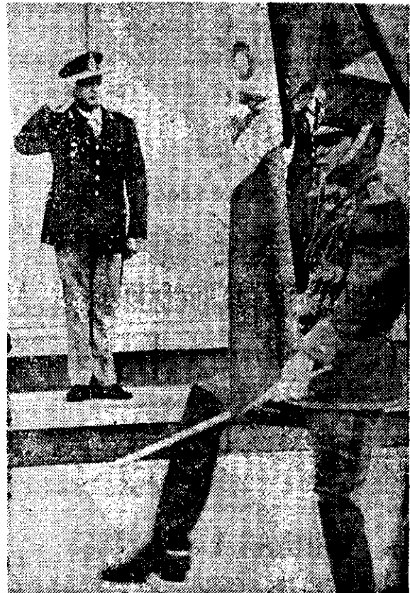
EL COMANDANTE en jefe del ejército argentino, general Cristino Nicolaidis, saluda el paso de la bandera durante su visita a Perú, donde se conmemoró el Día del Ejército.