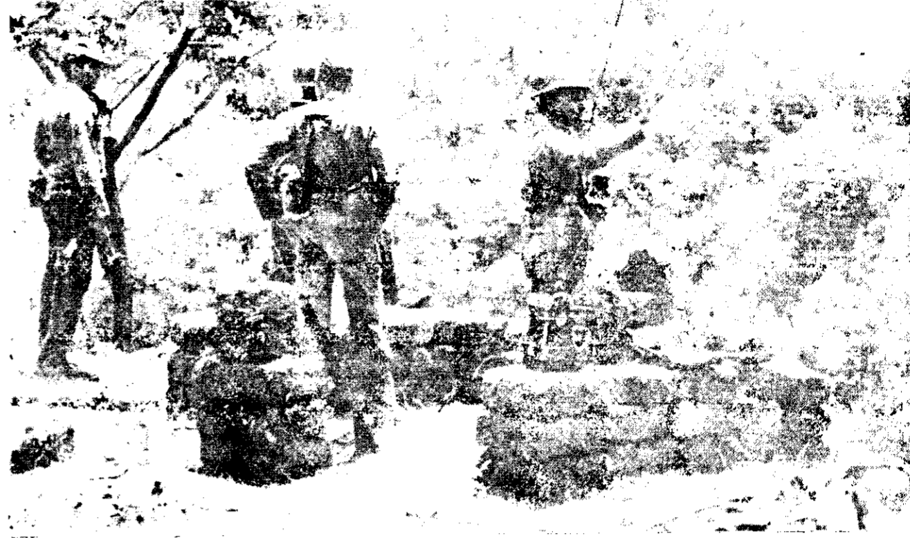
SOLDADOS hondureños en la frontera con Nicaragua. La táctica de la provocación como preludio a la agresión.

que no afecte a la pequeña y mediana propiedad. Somos partidarios de una economía mixta y de estímulo a los empresarios patriotas que contribuyan al progreso del país. Nuestra intención es desarrollar la planificación de la economía, no dejar nada librado al azar. La conducción política del Estado, por otra parte, se basará en el respeto al pluralismo y a los derechos humanos.