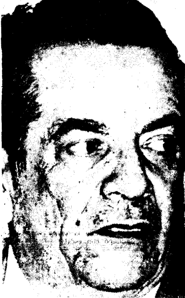
Roberto Suazo Córdova: durante su campaña electoral prometió "profundas reformas". Bajo su mandato aumentó la desocupación, la deuda externa y la represión.

Los dirigentes criticaron duramente al presidente Roberto Suazo Córdova y al general Gustavo Álvarez Martínez, y se declararon partidarios de la propuesta mexicano-venezolana de paz para Centroamérica, afirmando: "No somos ultras, ni nos consideramos vanguardia esclarecida. Evitamos las acciones al margen de las masas". Expresaron también que "todo el pueblo debe ser