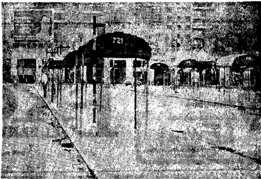
LAS TERMINALES de autobuses de Buenos Aires amanecieron desiertas ayer debido a un paro nacional general, de aproximadamente 9 millones de trabajadores, que se declaró a las 0.00 horas de ayer.

Por su parte, el Premio Nobel de la Paz, Adolfo Pérez Esquivel, indicó en Viena que insta a sus compatriotas a que se unan para pedir la vuelta a la democracia en su país, "a través de los partidos políticos, y sin violencia".