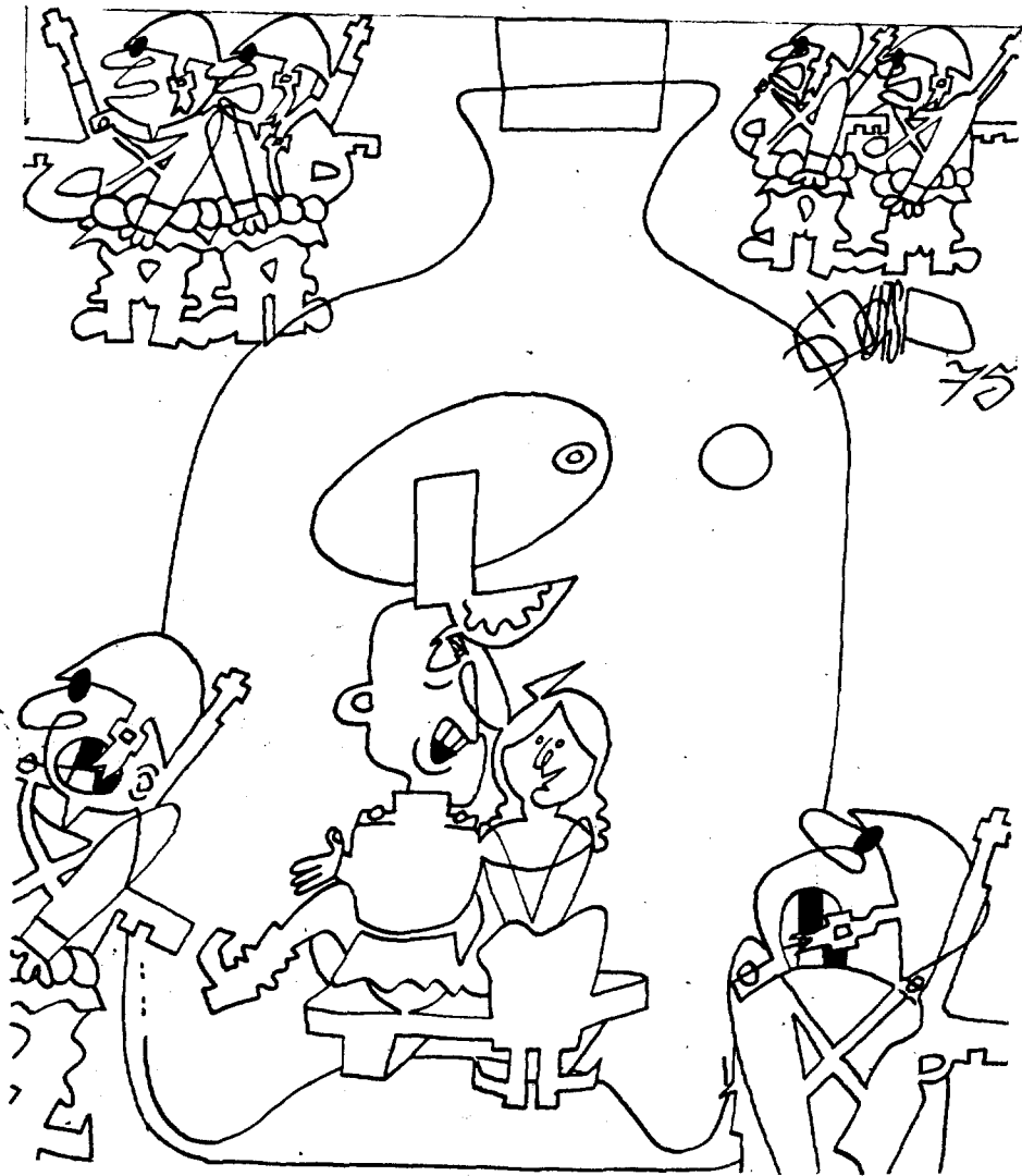
—¡Solos, faneses y descangallados...!