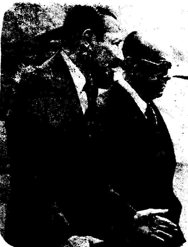
LA SITUACION boliviana no fue examinada durante la reunión que celebraron hoy en Brasilia los presidentes de Argentina y Brasil, generales Jorge Rafael Videla (izquierda) y Joao Figueiredo, respectivamente. El anuncio fue formulado por el canciller argentino, brigadier Carlos Washington Pastor en declaraciones a los periodistas, y agregó que "eso no impide que se converse sobre ese tema en cualquier otro momento".

Ya en la actualidad —continúo el conferenciante— los mecanismos puestos en juego por el Estado en contra de los trabajadores, a base de una fuerte oleada de actos terroristas, es difícil explicar el relativo éxito de la política salarial que hoy día se presenta en ese país sudamericano.