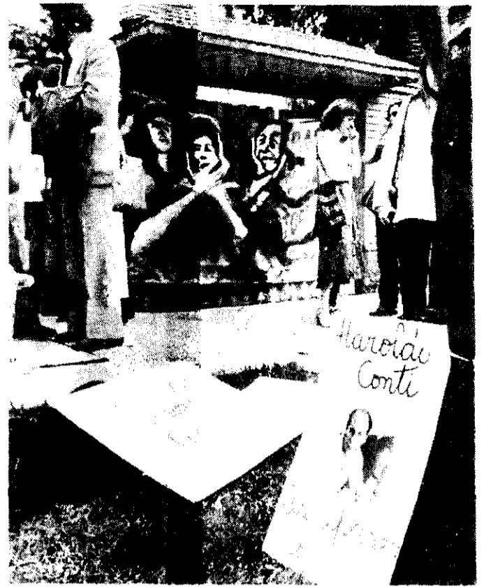
La imagen de las Madres de Plaza de Mayo, extendida sobre la puerta misma de la embajada argentina en México

*Ex presidenta de la Federación Argentina de Siquiatras.