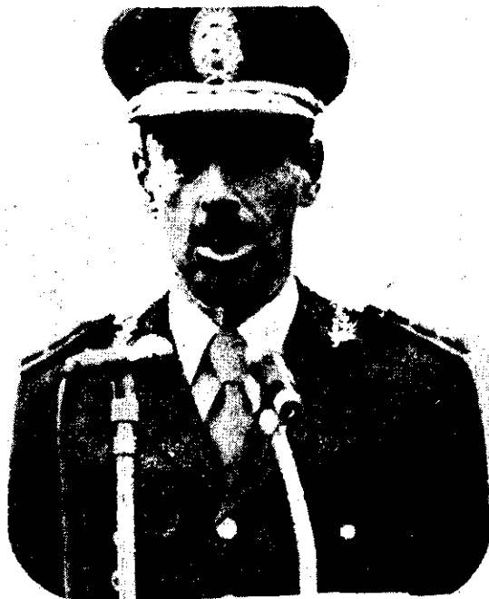
JORGE R. VIDELA

El hacer de Hernán Siles Zuazo un satanizado "comunista" servía a los fines quedantistas de los facciosos militares bolivianos. Que Videla y su régimen acepten ese precepto como válido, para hacerlo tragar ante el mundo como "alto grado de riesgo" ideológico, es un típico favor de esos que se intercambian las castas militares y pretorianas para cohonestar sus tropelías y adhesiones cuarterales. En última instancia explicará que esta tardía re-edición de la teoría de las fronteras ideológicas la enuncie el general que deberá ceder turno, en marzo de 1981, el general que la volvió a exponer en Bogotá en 1979, Roberto E. Viola. Añádesele una pizca del arrogante triunfalismo de quienes se proclamaron victoriosos en lo que designaron como "guerra sucia", y ya se completará el gusto: la "argentinización" de América.