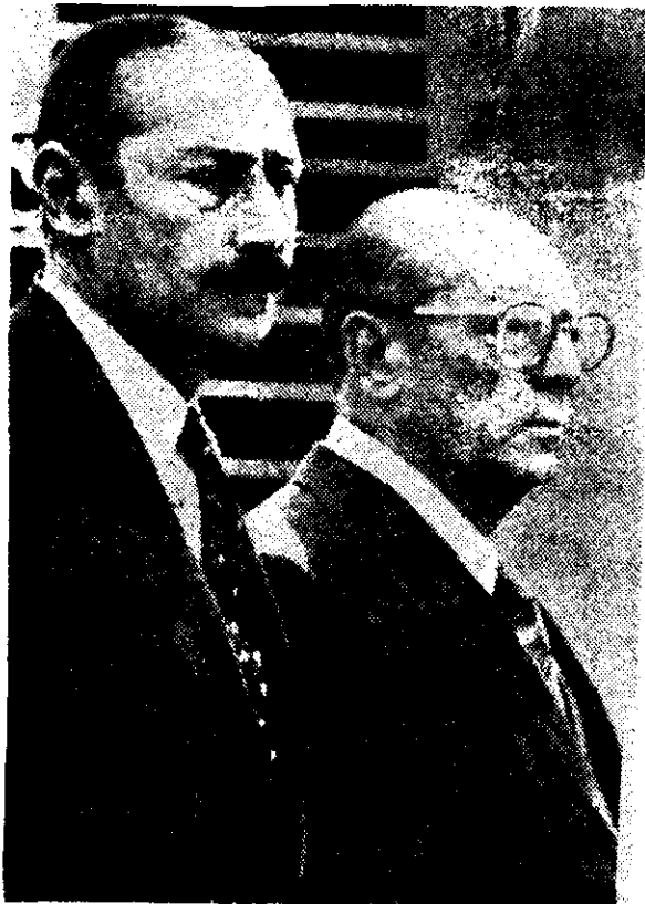
JORGE RAFAEL Videla, Presidente de Argentina, fue recibido ayer en Brasilia por el mandatario brasileño Joao B. Figueiredo, al inicio de una visita de cinco días a territorio carioca.