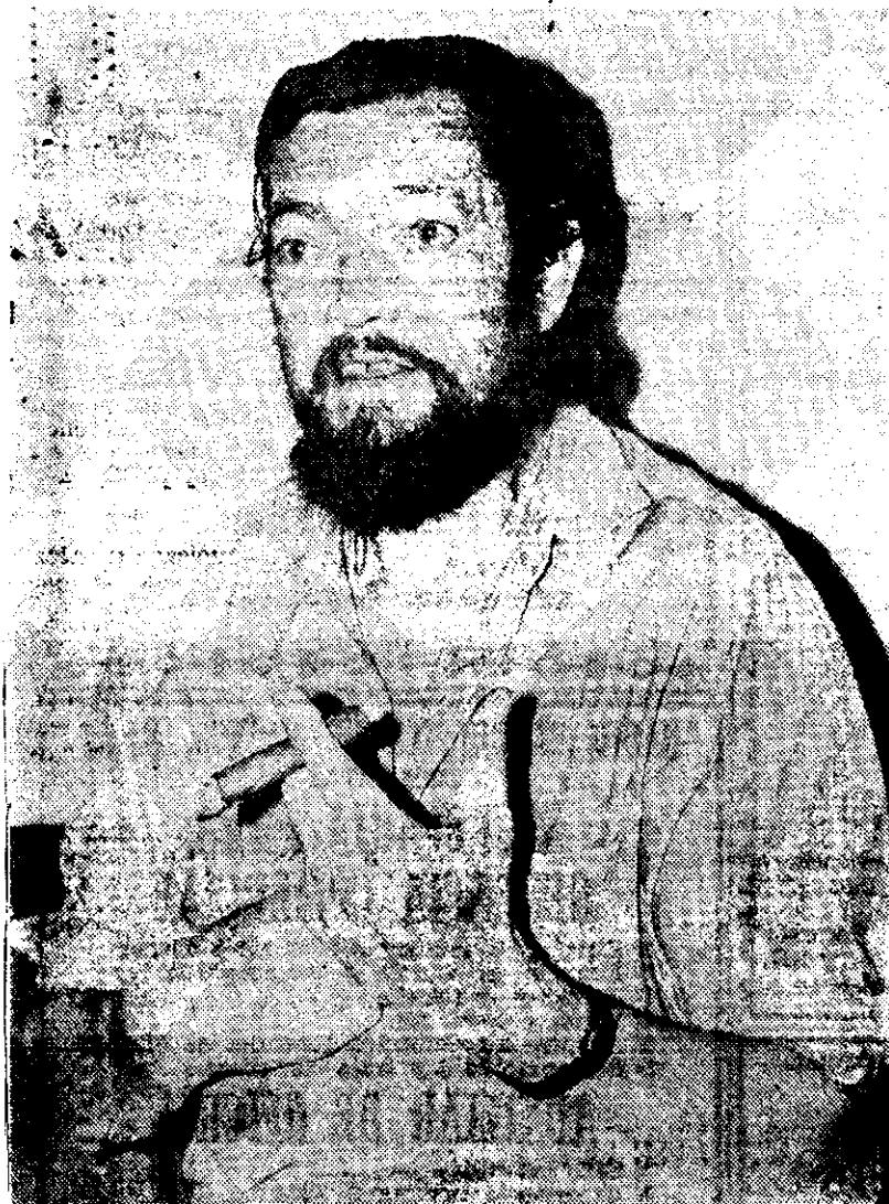
JULIO CORTÁZAR ha sido invitado para participar en un encuentro en México.

¿Qué ha sucedido en los últimos veinte años, en los que la inmensa mayoría de los hombres más lúcidos, más inteligentes, más preparados —desde científicos a escritores, desde artistas hasta especialistas— no pueden vivir en sus países latinoamericanos, ahora bajo regímenes dictatoriales? Esta dramática cuestión será planteada el próximo 10 de septiembre en un acto que sin duda será de resonancia entre todos los exiliados y dispersos de Argentina, Chile, Uruguay y otros países hermanos: un encuentro que se denominará "El exilio de la cultura".