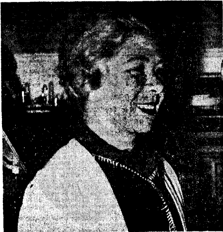
ALFONSINA STORNI será recordada por el XLII aniversario de su muerte.