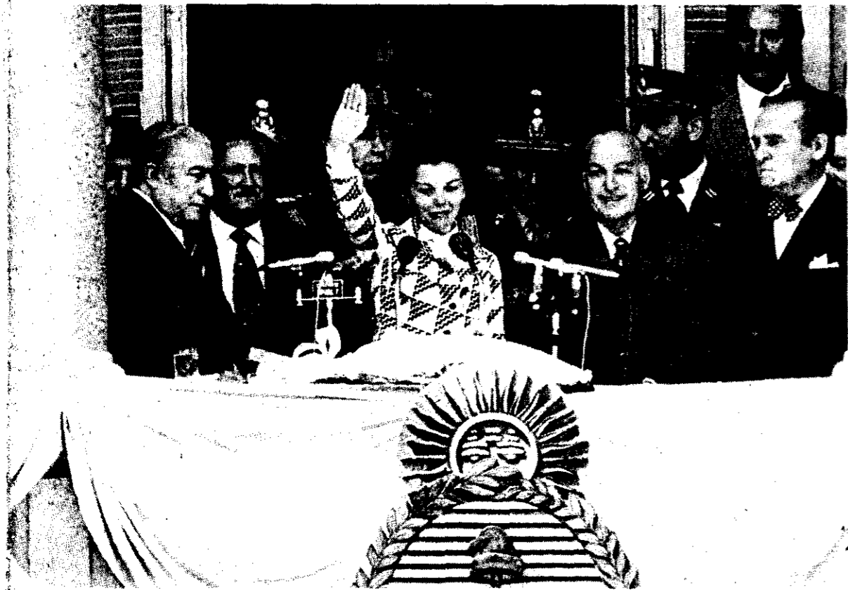
La influencia de López Rega, "El Brujo", en el peronismo de los últimos años fue determinante, en especial durante el periodo de la expresidenta Isabelita, con la cual se le veía en todo acto oficial.

Durante un año fue el hombre más famoso de América del Sur. Quizá sea arrestado dentro de unas horas en cualquier lugar del mundo. Quizás pasen diez años y López Rega no sea arrestado, porque prescriban sus causas o simplemente porque a nadie interesa ya castigar una política para siempre muerta. Será una discusión legal, porque para el hombre común López Rega es una parábola que ha cumplido su recorrido definitivamente.