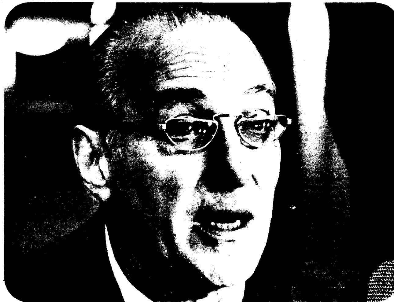
Pese a su renuncia en dejar el poder, él insistía en decir que "mi única ambición es retirarme y que me saluden por la calle".

Otras versiones sostienen que Perón, Isabelita, López Rega y su yerno, Raúl Lastiri, se habrían conocido en el ambiente nocturno de Panamá, donde Perón residió antes de instalarse en Madrid definitivamente. Quiere esta leyenda que López Rega habría sido cantante, Raúl Lastiri portero e Isabel integrante del cuerpo de baile.