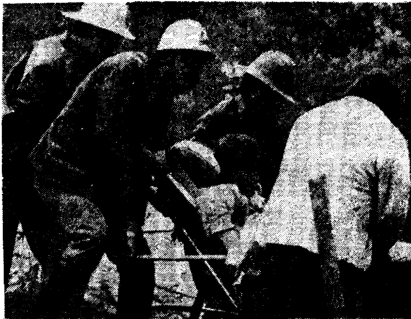
EL SECRETARIO de Programación y Coordinación Económica de Argentina, Guillermo Walter Klein, es retirado ileso por varios bomberos, de las ruinas de su residencia, ayer, en Buenos Aires, después de que la casa fue ametrallada y dinamitada por terroristas. Dos guardaespaldas del funcionario murieron.