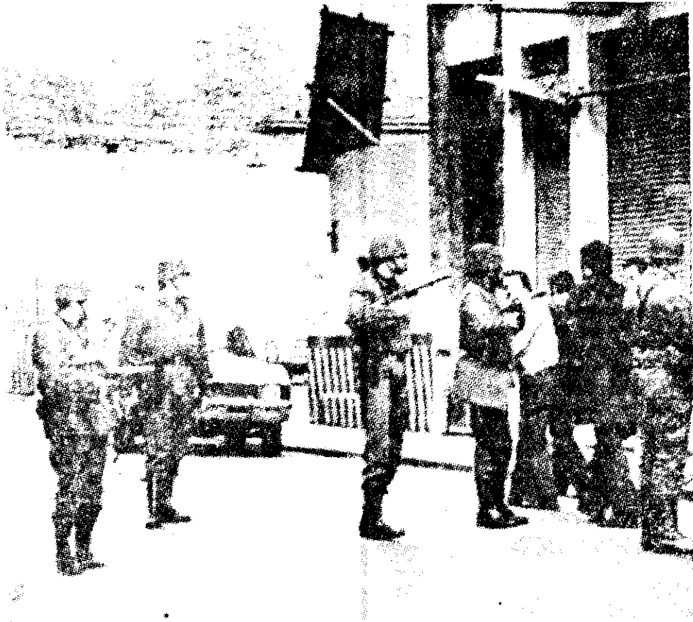
Control policiaco de rutina en las calles de Buenos Aires, en julio de 1976.

Una política similar a la de Martínez de Hoz, aunque menos severa, ya fue ensayada una vez en Argentina, a fines de la década de los 60, bajo el gobierno militar del general Juan Onganía. Aquel experimento se quebró cuando se extendió por el país una ola de motines obreros y estudiantiles, que el ejército tuvo que reprimir con tanques y cañones de grueso calibre. Entonces surgieron los primeros brotes guerrilleros, cuyo florecimiento el ejército trata ahora de extirpar. 7 largos años después. Si ahora se repitieran los sucesos de 1969, la matanza alcanzaría proporciones inauditas, porque tanto el