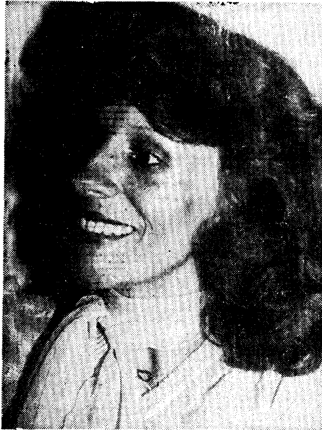
DE MODELO A ACTRIZ

:: La Artista Argentina Confiesa su Predilección por los Poemas de Benedetti