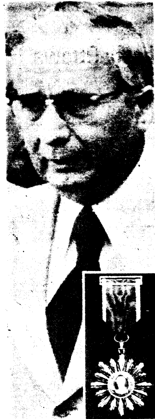
EL "GRAN MAESTRE" de la P-2, Licio Gelli. En la parte inferior, muestra de la condecoración argentina que se le confirió, la de Gran Cruz del Libertador San Martín.

Había razones paralelas a las meramente políticas. Una de ellas era la inminente inauguración, en Buenos Aires, del Banco Ambrosiano de América del Sur, filial del Banco Ambrosiano de Milán, cuyo presidente, Roberto Calvi, acababa de ser arrestado en Italia acusado de exportación ilegal de capitales. Otra era la implicancia del escándalo sobre el grupo