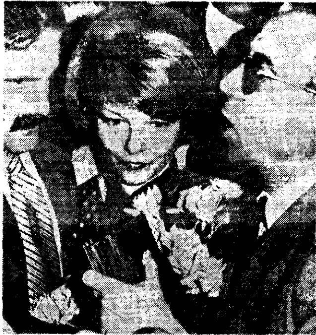
LA EX PRESIDENTA de Argentina, Isabel Perón al llegar al aeropuerto de Barajas, en Madrid.