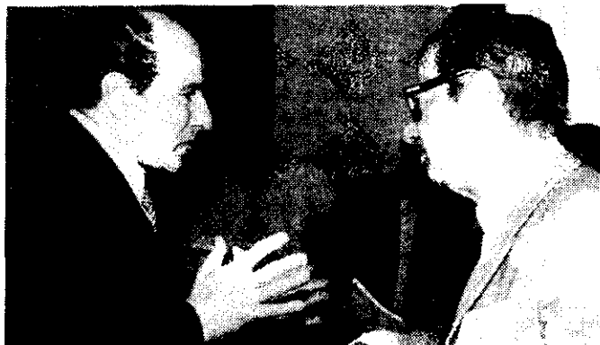
El embajador argentino ante la OEA, Raúl Quijano conversa con su homólogo brasileño, Alarico Silveira.

Por otra parte, hasta las últimas horas de hoy la situación en torno al informe de la Comisión Interamericana de Derechos Humanos perma-