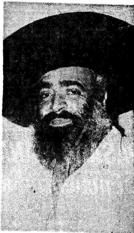
JORGE CAFRUNE, a su arribo a México, ayer en la madrugada.

A partir del viernes iniciará sus recitales en la Universidad de Guadalajara, para continuar después en las de Hermosillo, Veracruz, Jalapa, Monterrey, Durango, Tampico y en la Universidad Metropolitana del Estado de México.