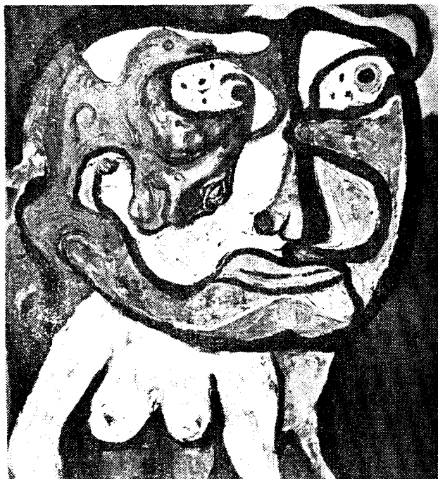
SER HIBRIDO AÑO 3900 de Raquel Forner

También está señalado para el día 26 de abril las presentaciones de Jorge Cafrune, cantante folklórico en el Teatro Hidalgo a las 19:30 y 22:00.