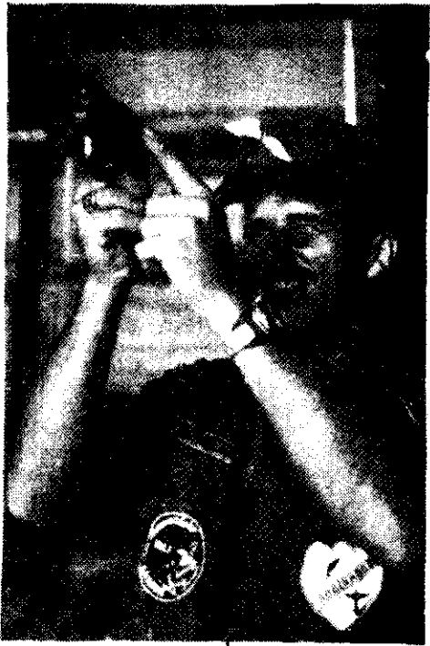
EN OCASIONES, sus mismos jefes los describe como casos patológicos de narcisismo y exhibicionismo.

Salvo en casos contados, estos hombres no son oficiales egresados de colegio militares. Algunos simplemente eran suboficiales o soldados rasos con actuación en Vietnam. Otros, ni siquiera eso, sino simples lumpenes. Los veteranos inadaptados a la sociedad que hallaron a su regreso del frente, se automarginaron de ella. Los otros, se sentían incómodos o angustiados. En ambos casos, esta actitud pue-