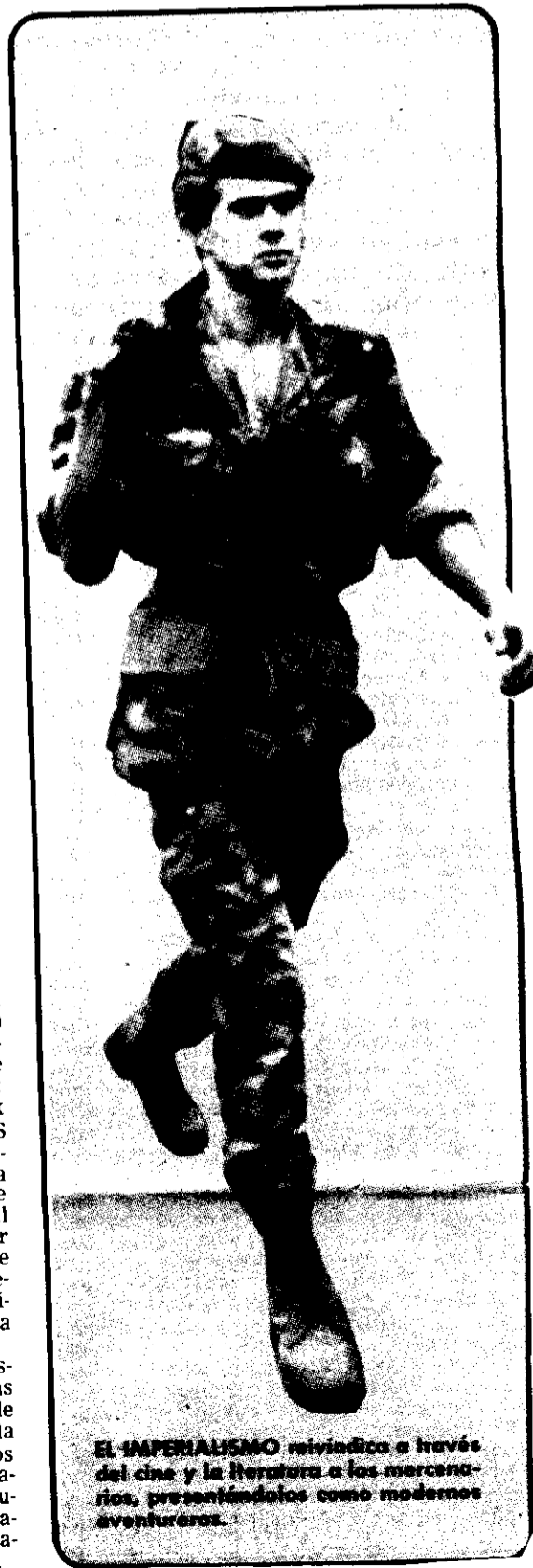
EL IMPERIALISMO reivindica a través del cine y la literatura a los mercenarios, presentándolos como modernos aventureros.

Por todo lo anteriormente expuestos merecen ser tenidas en cuenta las declaraciones del ministro Lopo de Nascimento. No sería extraño que la CIA, en combinación de los gobiernos militares del Cono Sur estuviera preparando una nueva "cruzada anticomunista" en África, un nuevo avasallamiento en contra de la libre determinación de los pueblos del Tercer Mundo.