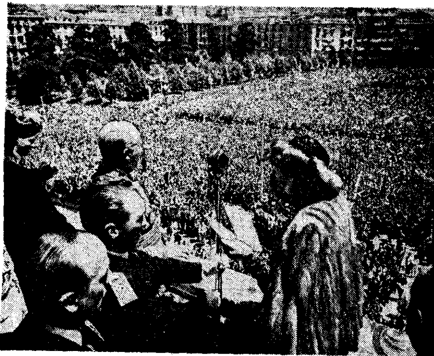
EN MADRID, EN 1947, Evita Perón, esposa del Presidente de Argentina, General Juan Domingo Perón, es aclamada por miles de españoles durante su visita oficial a España. La acompaña el generalísimo Francisco Franco.

go vendido a España al querer exigir que fuese reconocida en dólares la deuda que tenemos con ellos, lo que no es lógico ni justo, pues en el tratado consta que sea en pesetas o pesos. En este asunto se habían hecho algunas concesiones y yo no puedo cargar con la responsabilidad de que las generaciones venideras tengan que pagar esa deuda aumentada, cuando el asunto del trigo fue un pingüe negocio para el gobierno argentino, que se encargó de la venta fijando un precio cinco veces superior al que le costó. Luego está la negativa de la señora Perón a que cargaran trigo en los veinte barcos españoles que había en el puerto de Buenos Aires para dicho fin y que tuvieran que regresar sin un solo grano. No me explico por qué dicha señora nos tomó esa inquina a España, después de los enormes agasajos que aquí se le hicieron cuando nos visitó oficialmente (por expreso deseo de ella, como tú sabes bien). Pocos Jefes de Estado han sido recibidos de esa forma. Es fantástica la cantidad de millares de pese-