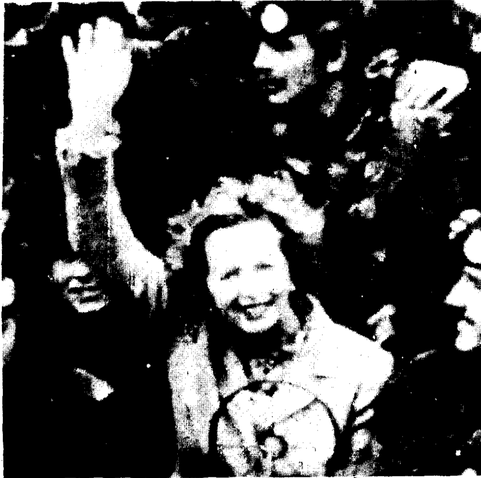
MARGARET THATCHER visita provocativamente las Malvinas, a 150 años de su ocupación militar por Gran Bretaña, mientras los No Alineados reunidos en Managua expresan su apoyo a la justa causa anticolonialista de la Argentina.

Sobre el candente tema centroamericano, el documento que sin duda será adoptado se inicia por una definición precisa: la crisis que sacude a la región tiene su origen en los graves problemas económicos y sociales y en la intervención e injerencia de que ha sido víctima, y de ninguna manera está vinculada a una confrontación este-oeste. Esta situación "se ha agravado como consecuencia de la intensificación de la injerencia imperialista", que se expresa en el "creciente involucramiento político y militar de los Estados Unidos en El Salvador", en haber transformado a Honduras en un arsenal para la agresión permanente contra Nicaragua, en el suministro de armas a los genocidas guatemaltecos. En el caso de los dos últimos países, la acusación incluye igualmente a Israel, cuya influencia belicista y armamentista en la zona se ha hecho sentir particularmente en el último periodo. Mientras Reagan certifica la vigencia de los derechos humanos en estos países y en forma impúdica los inunda de armas para masacrar a sus pueblos, nuevos hechos vienen a testimoniar la barbarie allí imperante, impulsada desde la Casa Blanca. Entre los más recientes, los siguientes: