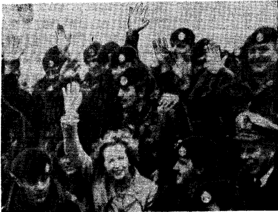
SOLDADOS del regimiento Royal Hampshire rodean a la Primera Ministra británica, Margaret Thatcher, durante su visita a las islas Malvinas. La Premier —de quien Ronald Reagan dijo que "es el mejor hombre de Inglaterra"— rindió homenaje a los caídos en combate. (Información en la página 2)