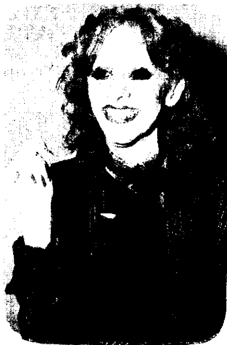
Nacha: Su arte causó impacto entre los españoles

los cambios de ropa, así como se caracteriza de mil formas diferentes.