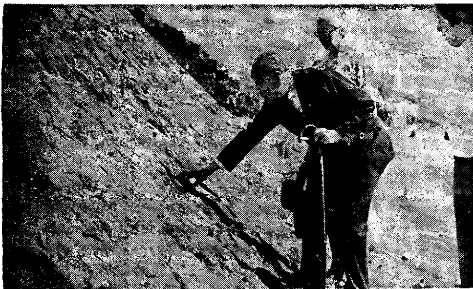
Tocando la tierra de Teotihuacán, Borges