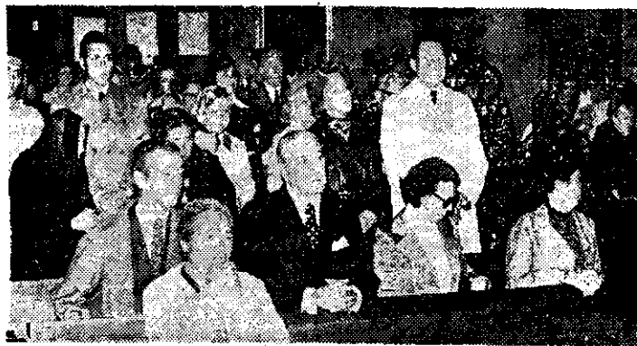
Concurrentes a la misa