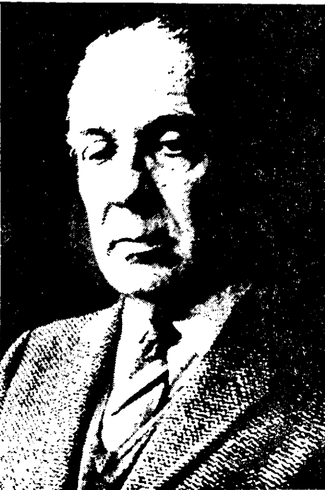
El escritor Borges

—Sí: "El Símbolo del Amor", una historia de cuatro muchachos; "La Noche que Desapareció Mr. Holland", narración detectivesca de los años 20s; "Herencia Macabra", novela de misterio; "El Columpio", una trama psicológica y "La Juventud en Busca de la Paz", la novela premiada.