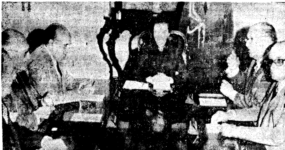
LA PRESIDENTA Isabelita Perón preside una reunión de su gabinete. De izquierda a derecha están los ministros de Educación, Oscar Ivanisevich; de Defensa, Jorge Garrido; de Relaciones Exteriores, Alberto Vignes; la presidenta, Isabel Perón; el ministro de Seguridad Social, Rodolfo Roballos, y el de Economía, Pedro Bonnani.

Por otra parte "Las 62 organizaciones" —la rama sindical del justicialismo— declararon hoy que "nuestro meridiano político pasa por la compañera María Estela Perón, única autoridad de nuestro movimiento y caudillo de los trabajadores".