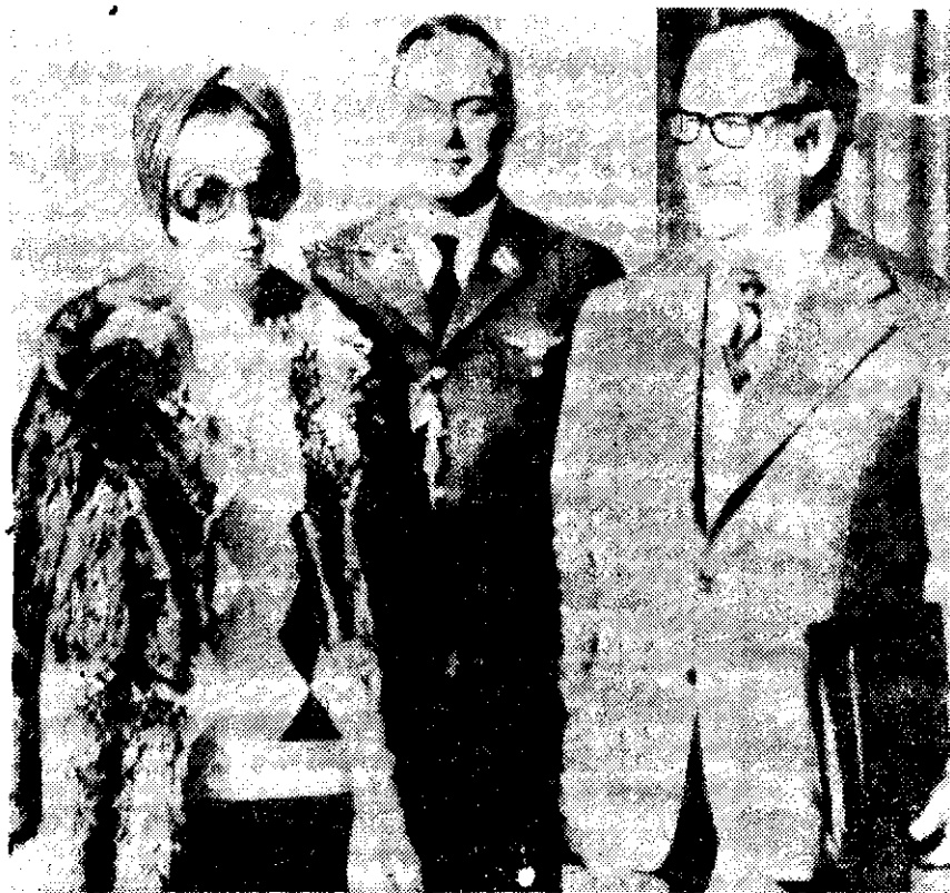
LA PRESIDENTA de Argentina, Isabelita, se reunió ayer con el ministro Justicia, Ernesto Corvalán Nanciarés (derecha), en el exterior de su residencia de Olivos. La mandataria había estado en cama desde el 21 de julio a causa de una fuerte gripe.

Y en esta capital, cuatro hombres armados dominaron a los reporteros y empleados de la oficina local de la agencia informativa United Press International y robaron 200 dólares (2,500 pesos), un reloj, un televisor y una calculadora.