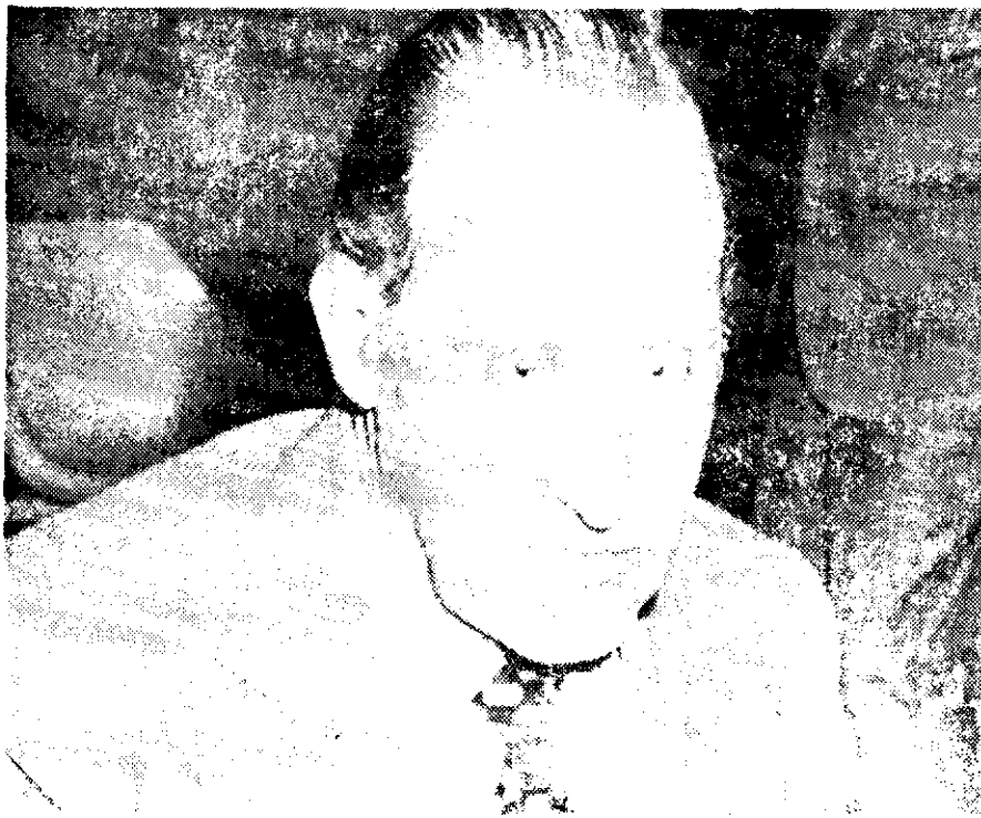
HAVELANGE DESATO una tormenta que provocó la ira de los argentinos. "Haremos el mejor mundial", reza el nuevo tango...

Canadá, Posible Sustituto de Argentina, Afirmó João en Brasil