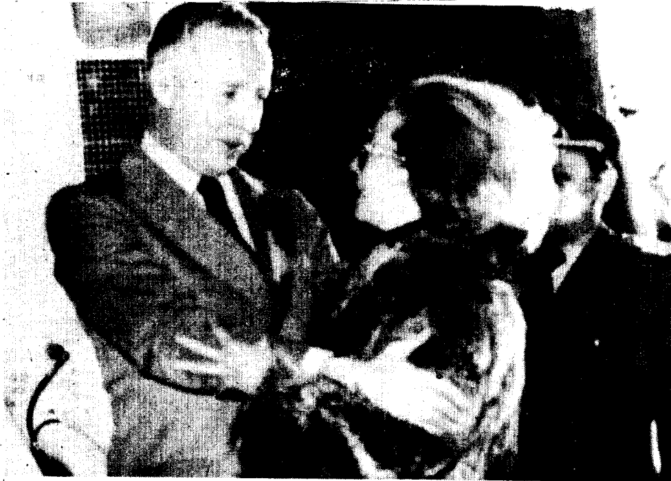
ITALO LUDER, presidente interino de Argentina fue a visitar a Isabel Perón en su retiro de la ciudad de Córdoba, mientras crece la oposición para que no retorne a sus funciones.