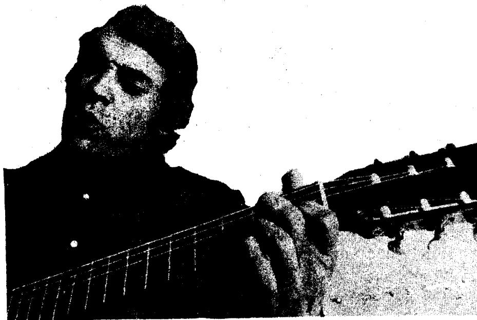
ESTOY muy contento de vivir cantando.