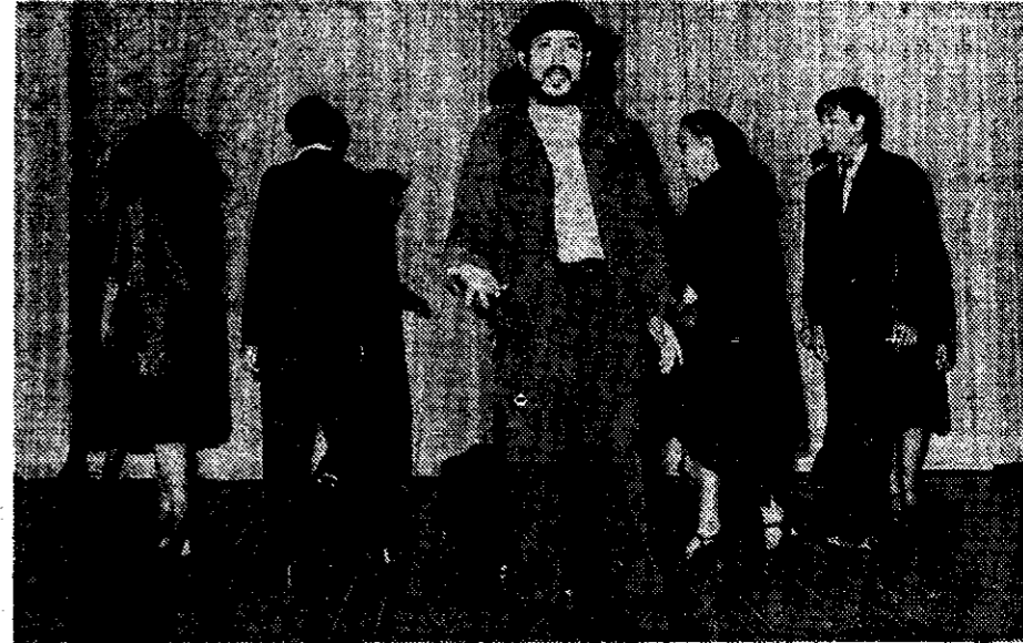
El Che Guevara canta en "Evita"