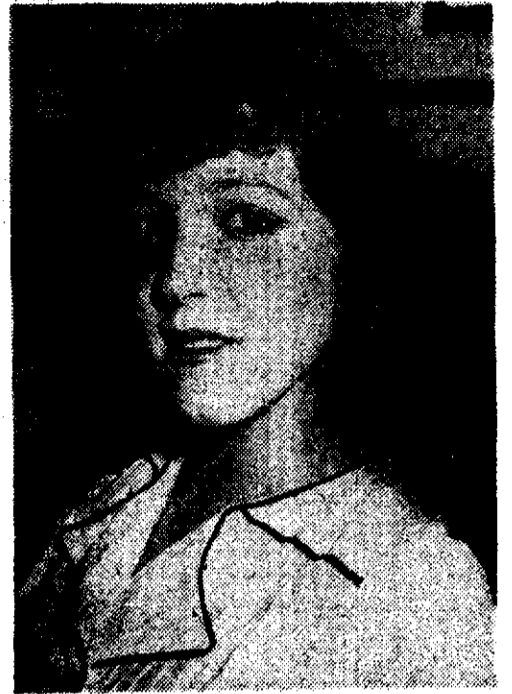
Rosalba D. Miguel, la amante de Perón