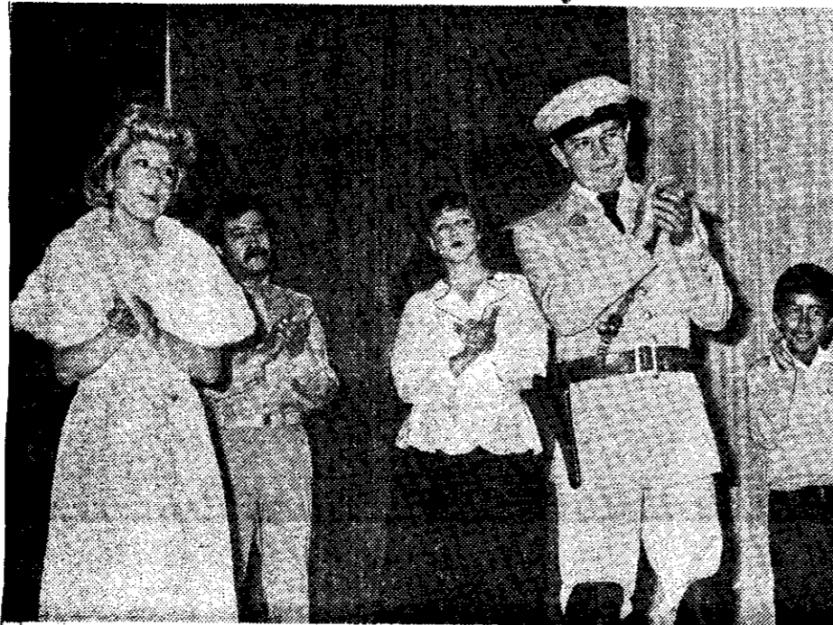
Escena de la comedia musical "Evita"

Sigue de la página diecisiete cipios, antes de figurar en el escenario político. La gira teatral de Evita no podía dejar de tocar esa plaza, (México). Y así, gracias al esfuerzo de un entusiasta grupo de teatro, el de la Escuela de Iniciación Artística Número 1 del INBA, respetando los textos originales de los autores Andrew Lloyd Webber y Tim Rice, representaron la ópera rock, "Evita", del 2 al 13 de ju-