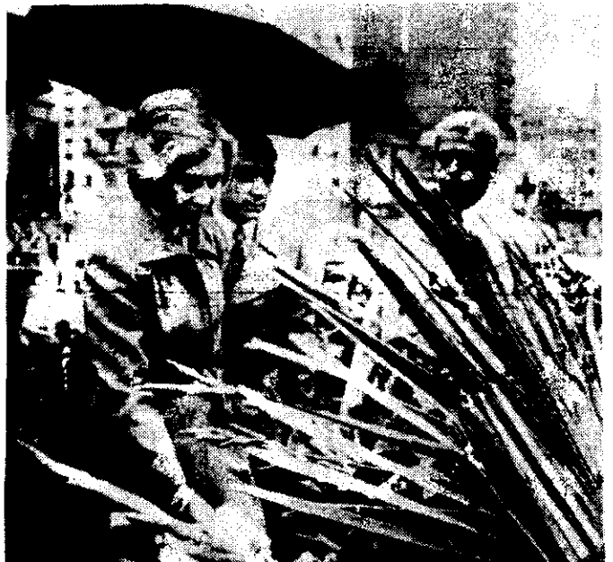
La reina Sofía de España depositó una ofrenda floral ante el monumento del general San Martín, en la plaza que lleva su nombre en Buenos Aires.