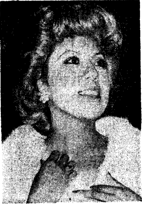
Silvia Aguilar, Evita Perón