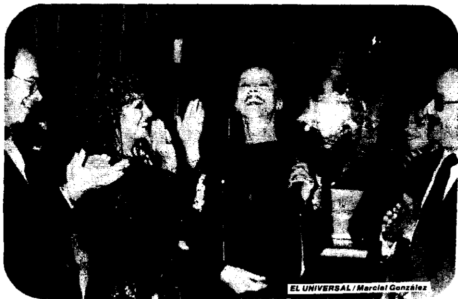
La Guevara muy contenta. Y la Pinal muy aplaudidora