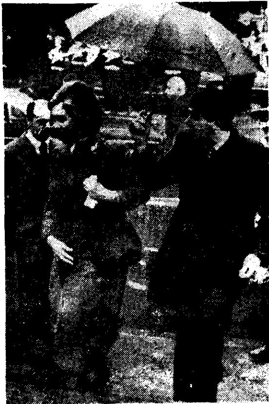
UN AGENTE de seguridad acompaña a la Reina Sofía de España, después de que presidió una ceremonia en honor de José de San Martín, libertador de Argentina, en Buenos Aires.

La corona de la Virgen, que fue pagada por los fieles con una colecta pública y bendecida por el papa Pío XI en 1928, está labrada en oro y tiene 20 centímetros de alto.