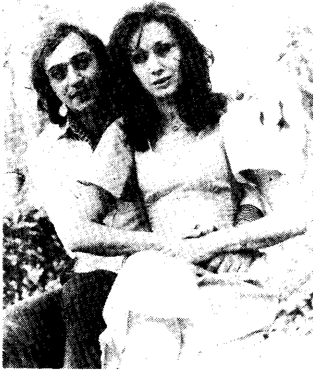
Luis Brandoni y Martha Bianchi