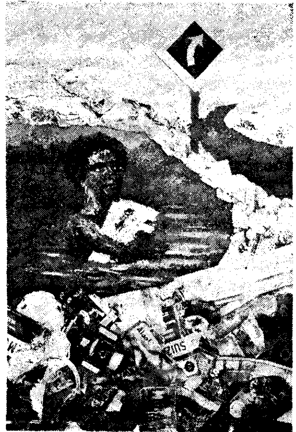
ANTONIO BERNI —"nunca dejé de ser surrealista del todo"—, pintor, muralista, grabador, ilustrador y escenógrafo argentino de la generación conocida como "El grupo de París", enviará a México este "collage": "Juanito en la laguna".