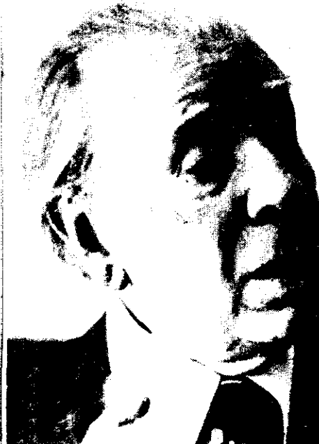
Jorge Luis Borges

La gran mayoría de las fuentes (escritores, críticos, académicos) coincidió, sin embargo, en que escritores como el argentino Jorge Luis Borges, los mexicanos Juan Rulfo, Carlos Fuentes y Octavio Paz, el brasileño Jorge Amado, el peruano Mario Vargas Llosa o el uruguayo Juan Carlos Onetti, el venezolano Miguel Otero Silva son de su misma talla y han contribuido al surgimiento de una nueva literatura latinoamericana.