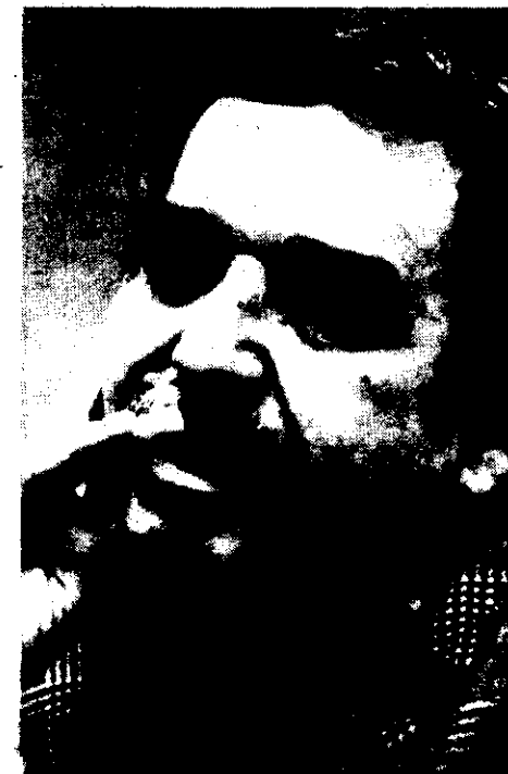
Gabriel García Márquez

En términos generales, aunque las cifras son difíciles de establecer, puede afirmarse que el lector latinoamericano "consume" entre un 60 y 70 por ciento de "producto importado" y un 40 o un 30 por ciento de literatura nacional o del continente.