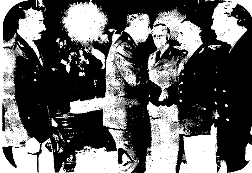
EL PRESIDENTE peruano, Francisco Morales Bermúdez, saluda a los miembros de la junta militar argentina. De izquierda a derecha, el general Ramón Agosti (Fuerza Aérea), el general Roberto Viola (Ejército) y el almirante Armando Lambruschini (Marina). Detrás de Morales, el mandatario Jorge Videla.

Concluye hoy la visita del mandatario peruano a Buenos Aires