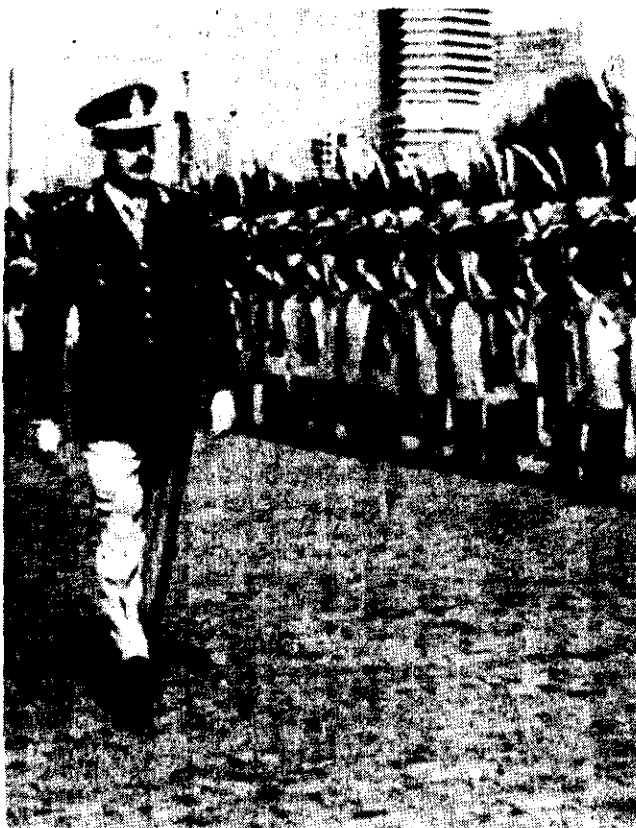
VIDELA pasa revista a los tropas.

El lector de El Día encontrará en nuestra sección Testimonios y Documentos este que es un testimonio eloocuente del fascismo latinoamericano.