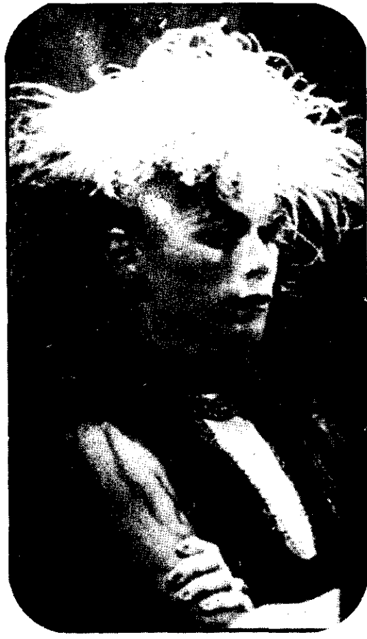
GERALDINE en Mamá cumple 100 años , película que dirigió Carlos Saura y que terminó su rodaje hace 15 días en Madrid. Lo segundo parte de Año y los lobos .

—A Carlos se le ocurrió la idea de hacer algo al