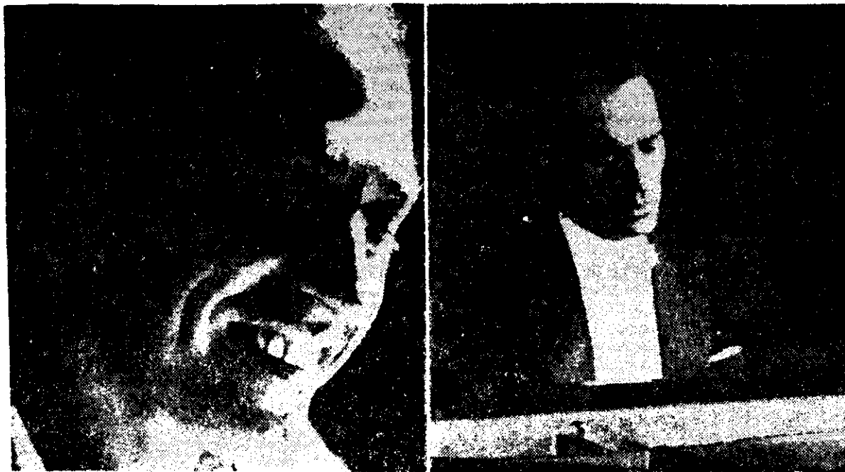
MIGUEL ANGEL Estrella, pianista