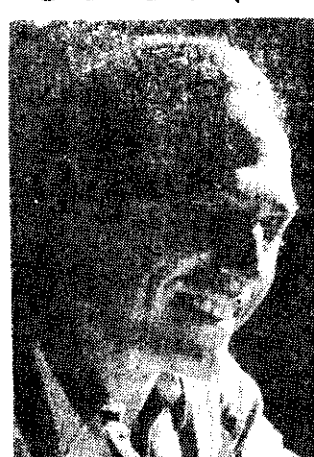
APLAUDIDO en Bruselas, Colonia, Roma, Andalucía, así como en Canadá, Uruguay y Panamá durante giras del pasado año, regresa a nuestro país el pianista argentino Miguel Angel Estrella. Hoy ofrecerá un concierto con temas de Beethoven y Brahms, a las 21:00 en la Sala Chopin.