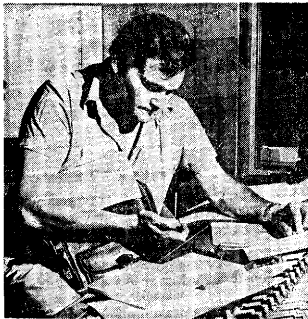
WALDO DE LOS RIOS

La agencia Telam difundió declaraciones de varios artistas: