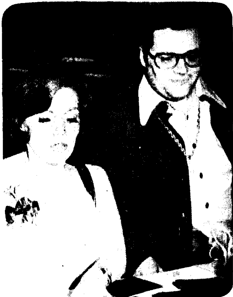
Waldo en compañía de su esposa Isabel Pisano, cuando vinieron de paseo al DF hace algunos meses.

Waldo de los Ríos", y agrega: "A primeras horas de esta mañana ha fallecido en la clínica de La Paz el compositor y director de orquesta Waldo de los Ríos, después de dispararse un tiro en la cabeza anoche, alrededor las once y media".