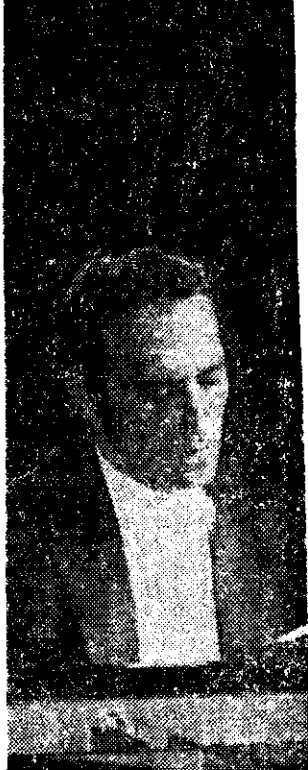
EL PIANISTA Miguel Angel Estrella

En la Sala Chopin, hoy sábado, a partir de las 21 horas, el pianista Miguel Angel Estrella ofrecerá un concierto con trozos de Beethoven y Brahms.