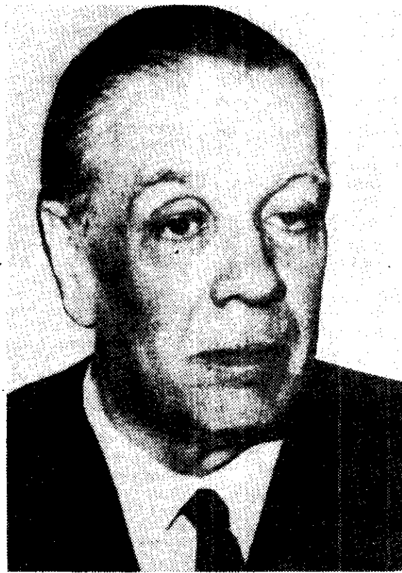
El escritor latinoamericano Jorge Luis Borges, que se califica a sí mismo de «candidato vitalicio al Premio Nobel», es titular de numerosos otros galardones literarios.

Quizá ello ocurra porque Borges, que señala en alguna de sus obras que «un hombre es todos los hombres, que el miserable John Vincent Moon (el protagonista de La forma de la espada ) es al mismo tiempo el genial William Shakespeare», también afirma: «Todos los americanos son nostálgicos europeos en exilio».