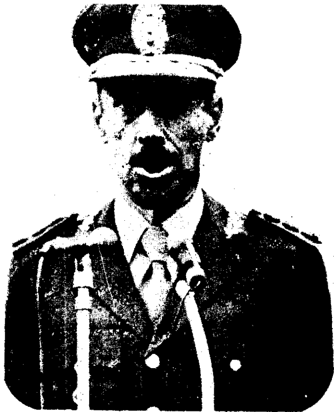
VIDELA... la cabeza de una línea opresiva.

El nuevo presidente formó un gobierno de tintes corporativistas o lo que se llama "fascitización del Estado". Su periodo presidencial, que duró hasta 1970, se caracteriza por la anulación de los partidos políticos y la suspensión de la Constitución argentina, y el estatuto de la llamada "Revolución Argentina".