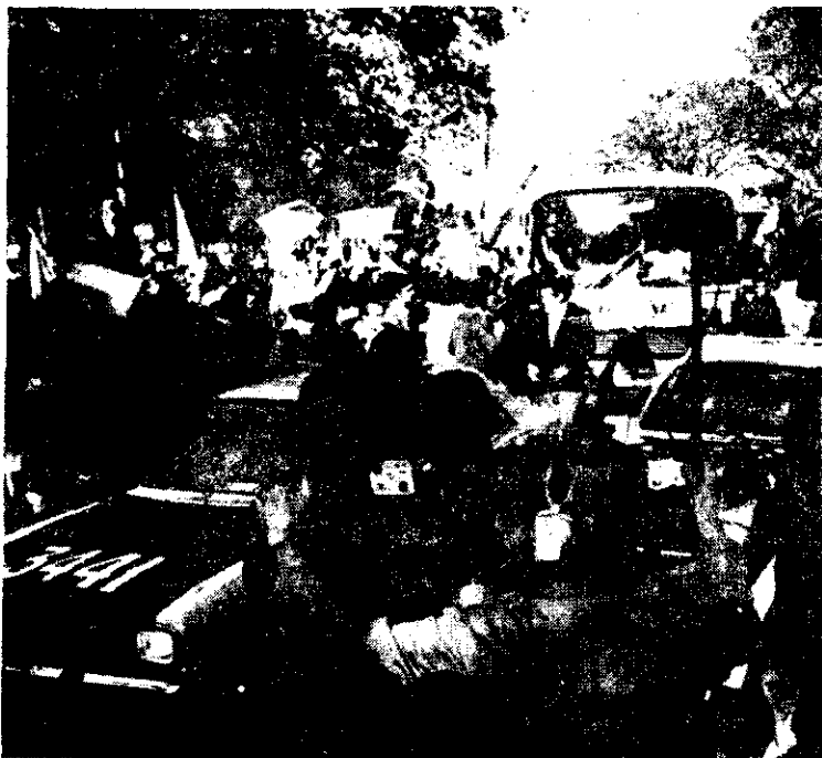
BUENOS AIRES.— Patrullas, policías, guaruras, todo fue inútil. La gente estaba loca y quería ver de cerca a sus jugadores. Argentina entera los proclama ya como campeones.

SI ANTES del ya famoso 6-0 a Perú cuidaban a la selección de Argentina como a oro en lingotes, ahora la vigilancia aunque ya no parecía posible, se ha extremado: a estos cuatro guardianes los captó Ignacio Castillo, enviado de EXCELSIOR, en donde entrenarán para el domingo.