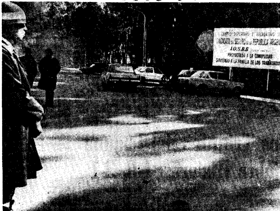
LA VIGILANCIA se ha extremado en vísperas del final del Campeonato del Mundo y las concentraciones de los cuatro sobrevivientes son inexpugnables. En la foto de Ignacio Castillo, enviado de EXCELSIOR, el centro deportivo del Sindicato del Seguro, donde se hospeda Argentina.