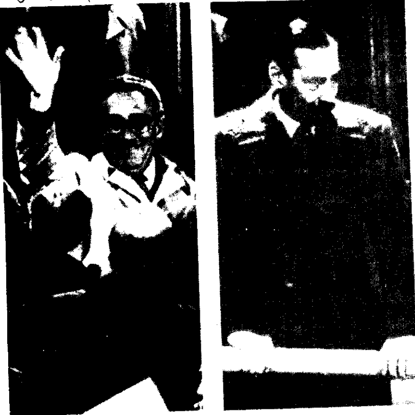
Henry Kissinger, ex secretario de Estado de EU y el general Jorge Videla, jefe de la Junta Militar, en Rosario, mientras segulan el cotejo entre Perú y la selección nacional de Argentina.