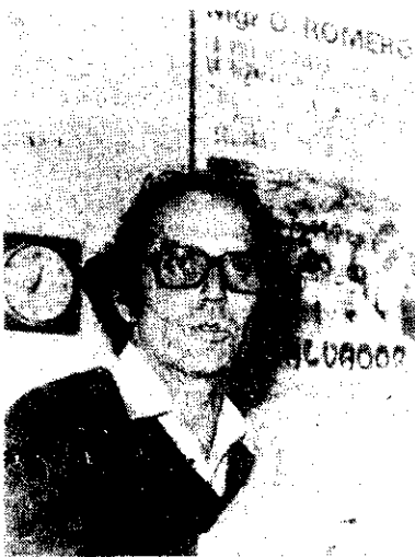
El profesor argentino Adolfo Pérez Esquivel, ganador del Premio Nobel de la Paz

OSLO, Noruega, 13 de octubre (UPI y EFE). — El argentino Adolfo Pérez Esquivel, campeón de los derechos humanos logrados por medios no violentos, ganó hoy el Premio Nobel de la Paz 1980.