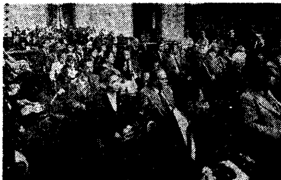
Aspecto de los asistentes a la ceremonia