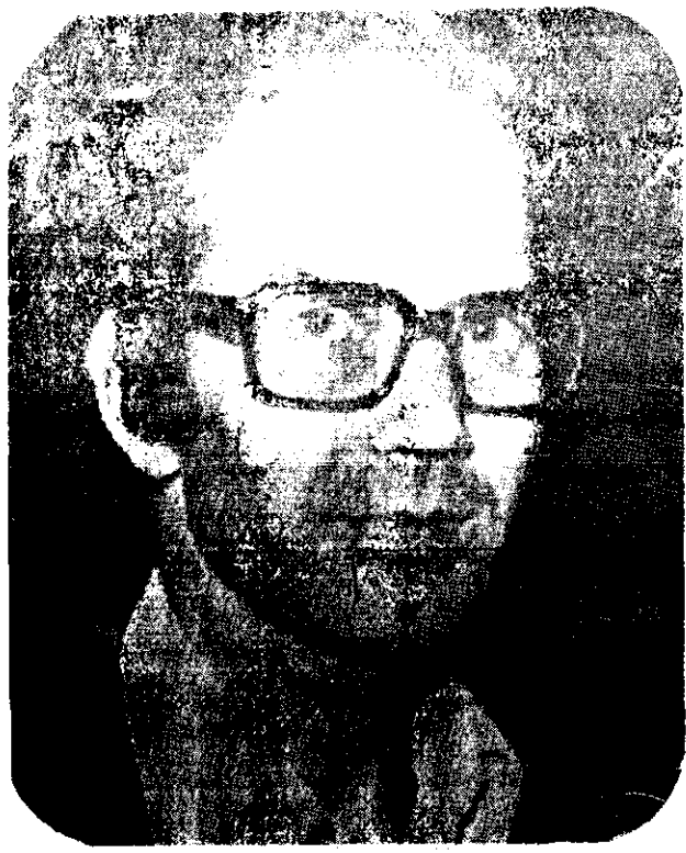
ADOLFO PEREZ ESQUIVEL