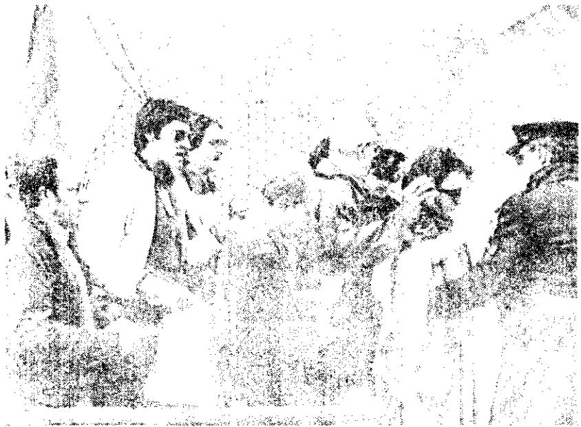
A pesar de las expectativas del gobierno argentino, los turistas no asistieron al Mundial como se esperaba.

Un opinión igual tiene el encargado de la tienda "L'uomo", de Florida: "En Buenos Aires un traje para caballero no baja de 200 dólares, mientras en Europa se puede conseguir casi por la mitad. Actualmente somos el país más caro del mundo, y el extranjero consiga en su país las mismas cosas a precios inferiores". Y así, la gente se pregunta en Buenos Aires: ¿Dónde están los turistas?".