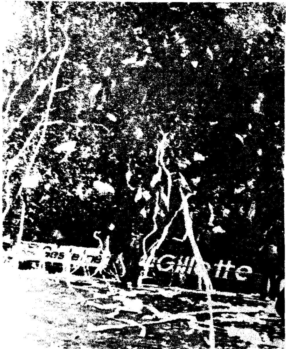
La tensión que imperó y durante el encuentro se desbordó y los argentinos, olvidándose de sus problemas sociales y políticos, lanzando serpentinas y confeti al aire, acompañados por los gritos de "Argentina, Argentina".