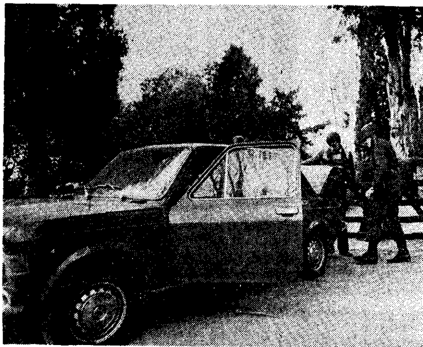
A MEDIDA QUE Argentina avanza en el Mundial y éste prosigue, las medidas de vigilancia se incrementan y ahora ya hasta las cajuelas de los coches son minuciosamente inspeccionadas por elementos del ejército.