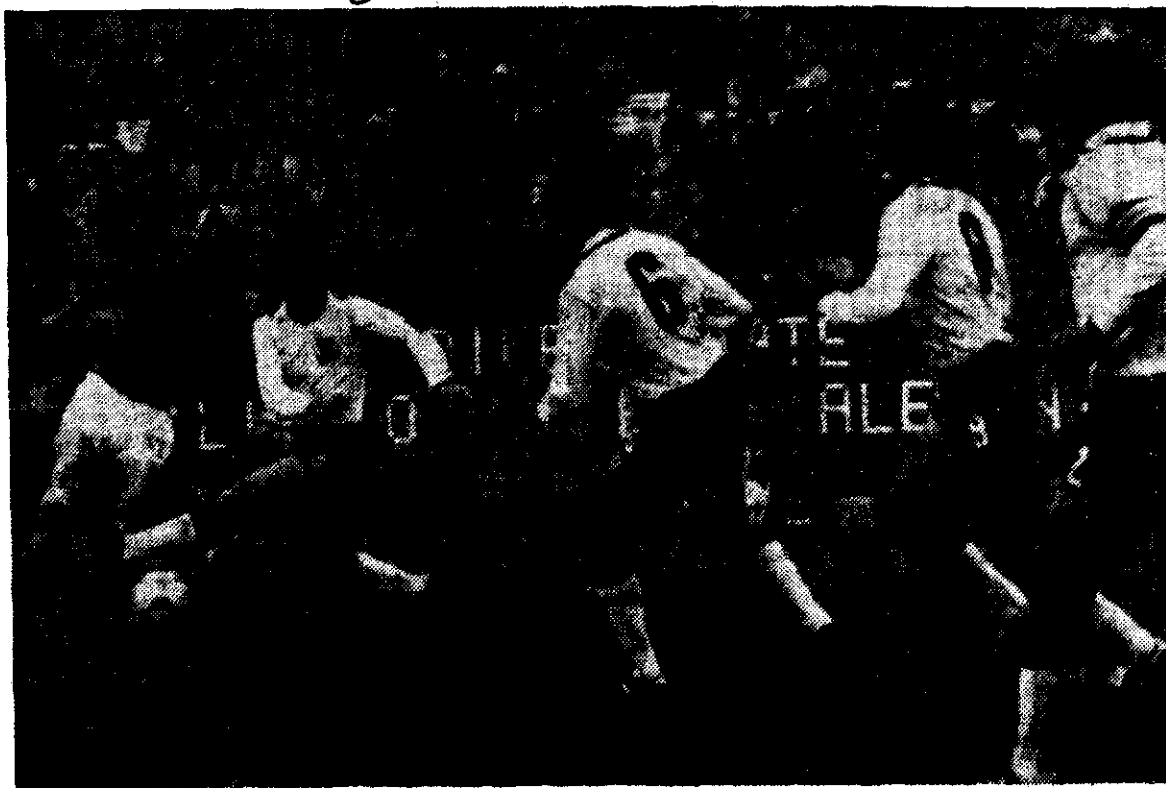
CUALQUIER SIMIL entre esta acción alemana y el origen del título de los ahora no tan apacibles "Montoneros" es mera coincidencia, además de un momento en el 0-0 protagonizado ayer por Alemania e Italia.