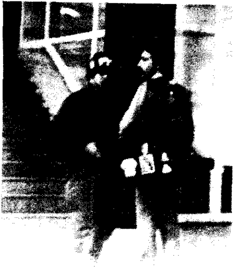
Un reportero gráfico argentino en el momento de ser detenido.