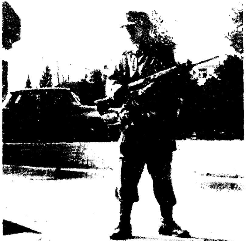
En las instalaciones donde se concentra la selección de fútbol argentina, en Buenos Aires, se redobló desde ayer la vigilancia militar. (foto Miguel Castillo/enviado).