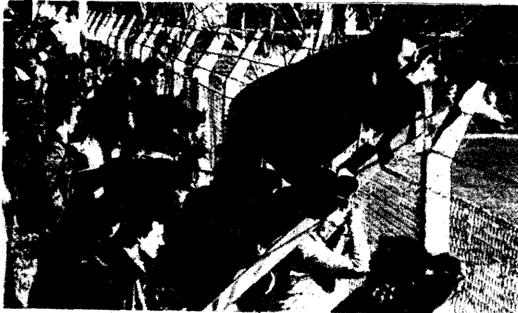
Joao Havelange, presidente reelecto de la FIFA, asiste a un "asado criollo" en el típico estilo argentino. Hasta prueba a vestir un poncho sobre sus hombros.