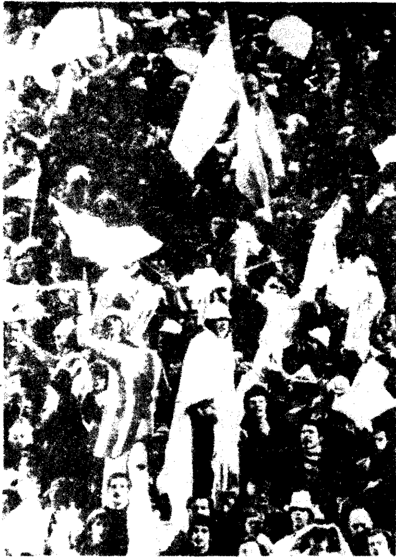
La euforia por el triunfo del seleccionado argentino, legítima alegría, se mostró ayer en Rosario y se repitió en toda Argentina. ¿Continuará después del 25, cuando el Mundial acabe y los problemas del país vuelven a reaparecer en toda su magnitud?