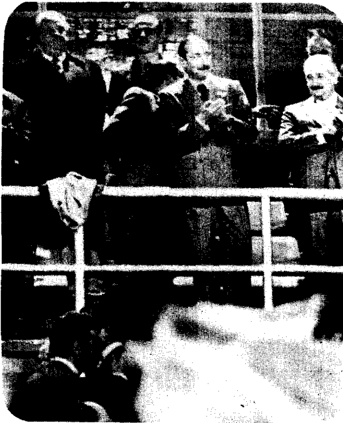
ROSARIO, Argentina, junio 14.—El general Jorge Rafael Videla, presidente de Argentina (centro) acompañado de algunas autoridades locales, es recibido con muestras de entusiasmo a su llegada al estadio de Rosario Central, para presenciar el juego Argentina-Polonia.