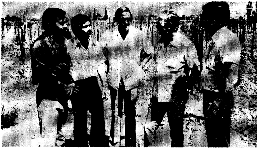
EN LA FOTO, el grupo de ingenieros agrónomos que realizan estudios en Mendoza, Argentina.