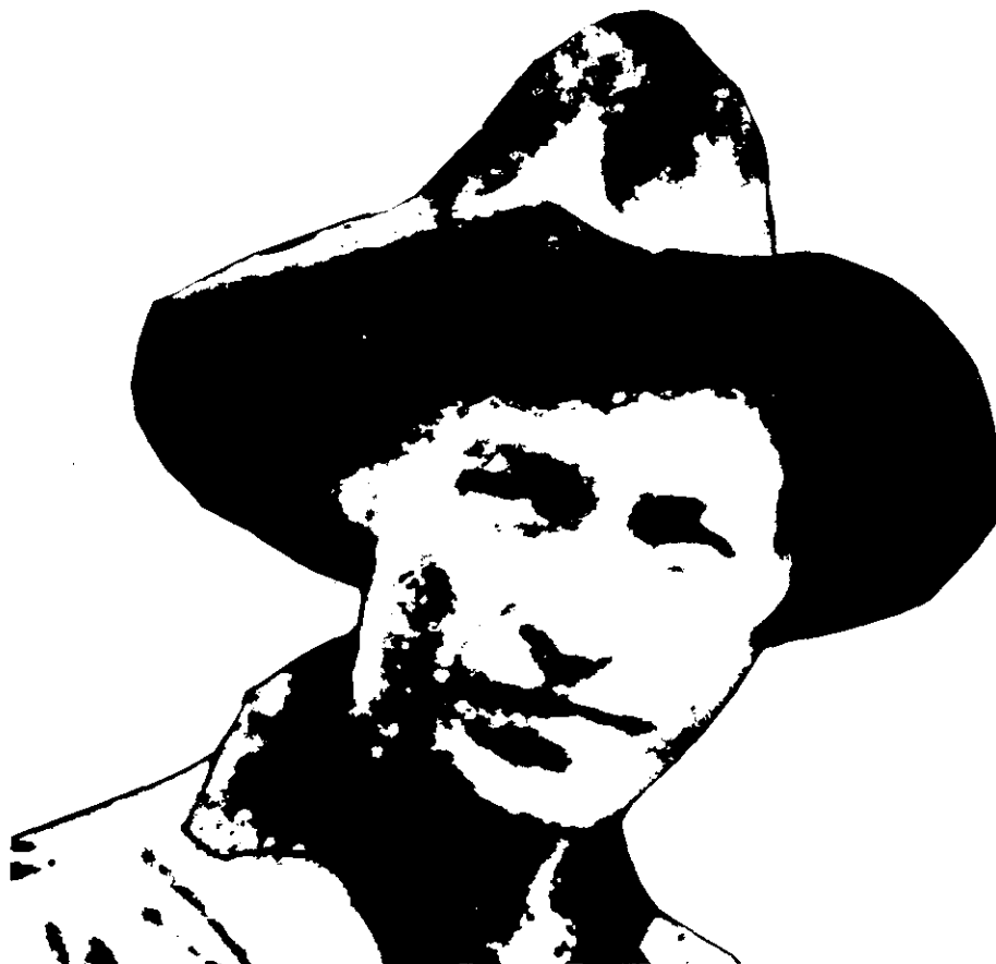
Augusto César Sandino, fuente de inspiración de todas las corrientes de liberación nacional que se han dado en Nicaragua desde su muerte, a manos de los Somoza

Como acto político, dijo un representante del FSLN "logramos casi un milagro: la unificación de toda la izquierda latinoamericana en apoyo a la causa del pueblo de Nicaragua. Por eso —agregó—, estamos ciertos de que el futuro de nuestra patria es el de una Nación liberada, el de una Nación sin Somozas ni guardias nacionales."