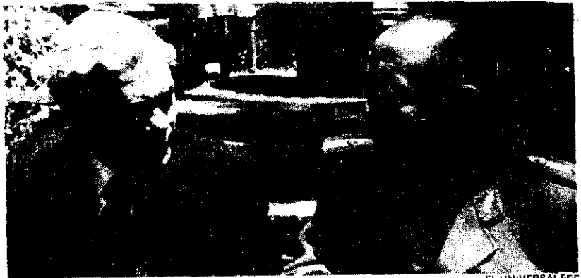
La batalla final se libró en la quebrada del Yuro, una profunda hondonada rodeada de cerros, hacia donde se presumía que se dirigía el Che Guevara, dijo el general Luis Reque - Terán al periodista César Peña, a la izquierda