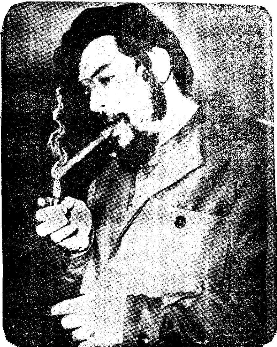
ERNESTO "CHE" GUEVARA , a diez años de su asesinato en la sierra de Bolivia, es recordado por el gobierno de Cuba, que para el efecto ha organizado una serie de actos en La Habana. En la gráfica del archivo de EL NACIONAL, aparece el guerrillero cuando en 1965 visitó El Cairo con motivo de una reunión de los países africanos. Guevara asistió a dicha conferencia en representación del Premier doctor Fidel Castro Ruz.