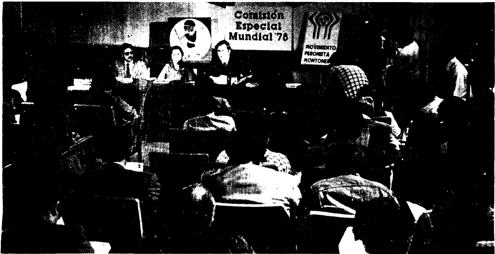
En conferencia de prensa, Montoneros anunció que no obstaculizará la realización del Mundial de Argentina, para que "los ojos del mundo vean la tragedia de ese país".