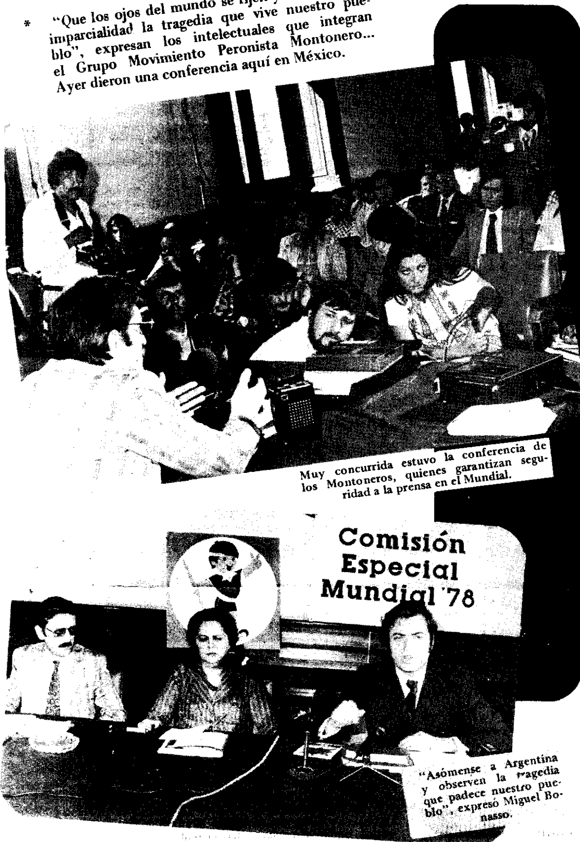
Muy concurrida estuvo la conferencia de los Montoneros, quienes garantizan seguridad a la prensa en el Mundial.

* "Que los ojos del mundo se fijen y observen con imparcialidad la tragedia que vive nuestro pueblo", expresan los intelectuales que integran el Grupo Movimiento Peronista Montonero... Ayer dieron una conferencia aquí en México.