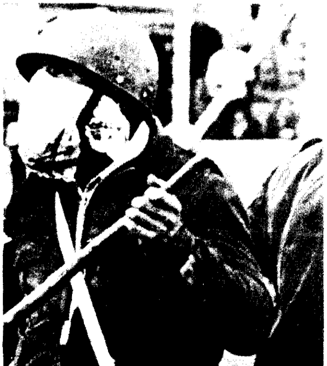
Las fuerzas armadas argentinas reprimiendo en un estadio. El fútbol también es escenario de las luchas populares.