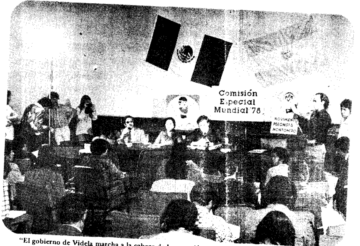
"El gobierno de Videla marcha a la cabeza de la represión mundial a la prensa", afirmó Bonasso.

* "Que los ojos del mundo se fijen y observen con imparcialidad la tragedia que vive nuestro pueblo", expresan los intelectuales que integran el Grupo Movimiento Peronista Montonero... Ayer dieron una conferencia aquí en México.