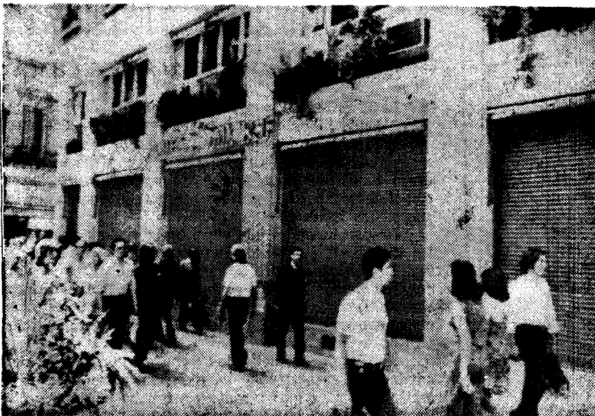
LA POPULAR TIENDA "James Smart", situada en la avenida Florida Buenos Aires, cerró ayer al comenzar el paro patronal contra el gobierno Isabel Perón.

"El mundo verde" de Kadafi "es la solución del problema de la democracia mediante la abolición de los partidos y los parlamentos" a través de un ente llamado "revolución popular", en la cual el partido "representa sólo una parte del pueblo dentro de "la tribu de la era moderna, una moderna día-