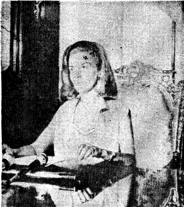
ISABELITA PERON informó ayer por televisión que no buscará su reelección para un nuevo mandato presidencial. (AP)