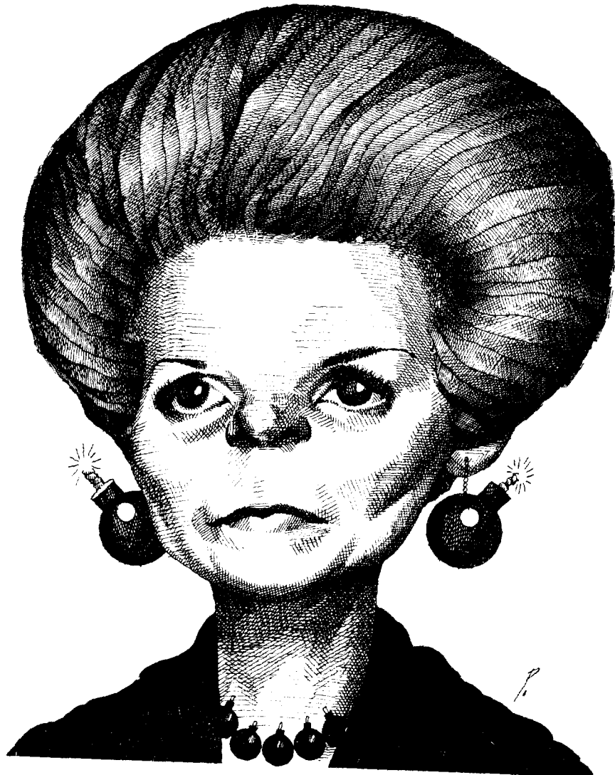
Isabel Perón... bombas hasta en los aretes.

Por si la presidenta no tenía preocupaciones, al final de la semana 6 de los 15 miembros del Consejo Nacional del Partido Justicialista dimitieron, y abundaron las peticiones de ciertos sectores para que se destituya al resto.