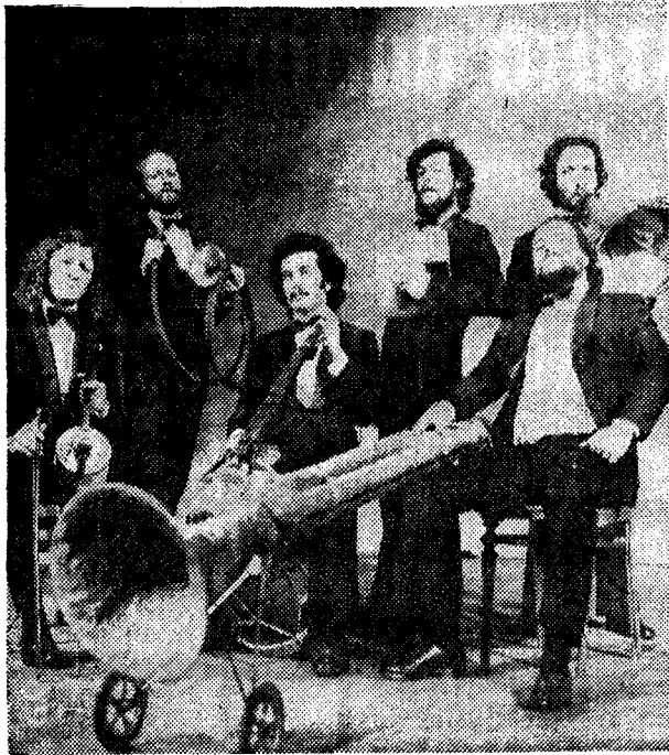
ESTOS SON los integrantes del grupo "Les Luthiers", con sus sorprendentes instrumentos musicales. Próximamente harán su segunda temporada artística en México.

Aunque parezca mentira, "Les Luthiers" son los que más en serio toman la música que ejecutan, ya encontraron la forma de afinar por medio de tapones el "Tubófono Parafínico"; sus artefactos musicales siempre están perfeccionándose y más bien parecen esculturas surrealistas; pero las sorpresas son constantes y muchas de ellas las traerán consigo, así como las nuevas composiciones de Johann Sebastián Mastropiero, a las que dan vida con sus geniales interpretaciones.