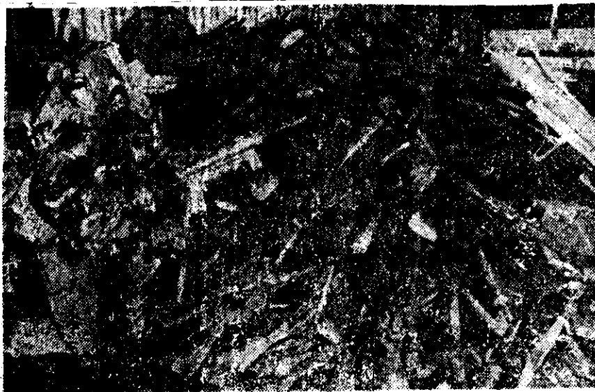
UN SOLDADO británico revisa una metralleta al lado del arsenal de armas abandonadas por los argentinos al rendirse después del ataque inglés a Pradera del Ganso.