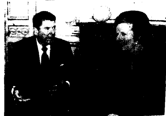
EL PRESIDENTE norteamericano, Ronald Reagan (izquierda), se reunió ayer en la embajada estadounidenses en París con la primera ministra británica, Margaret Thatcher, para discutir acerca del conflicto por las Malvinas.

De la crónica de nuestro corresponsal en Buenos Aires, destaca la transcripción de la siguiente frase del diario La Prensa de esa capital: "Si resultó inevitable desembarcar en las islas Malvinas, no convirtamos el acierto en una prolongación de la ocupación militar más allá de lo que el honor y el interés del país exija". (Más información en El Día Internacional, páginas 11 y 13).