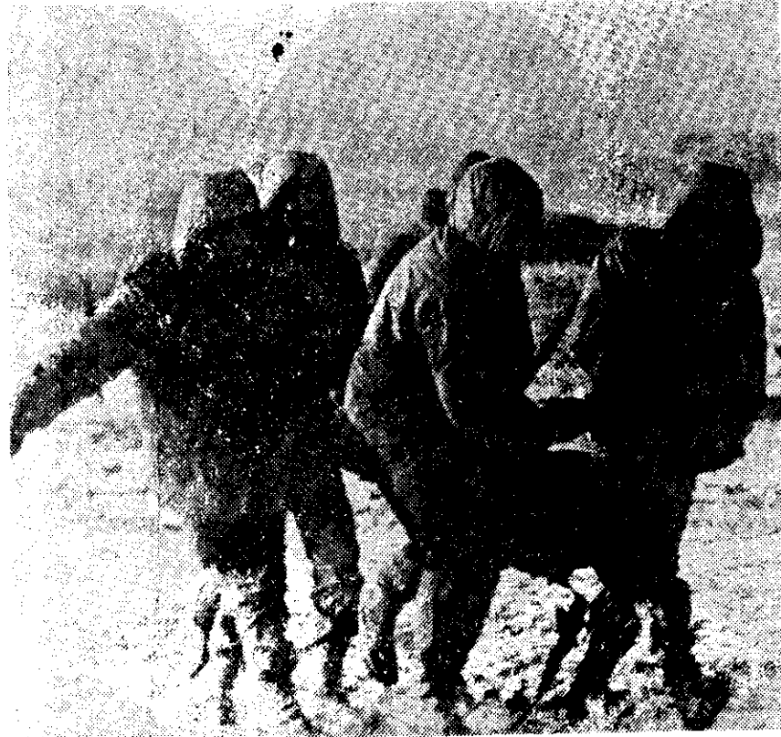
SOLDADOS ARGENTINOS rescatan a un compañero herido en Pradera del Ganso, luego de que se rindieron a los militares británicos. El Ministerio de Defensa Británico anunció que 250 soldados argentinos murieron en los enfrentamientos de aquel lugar y Puerto Darwin, en tanto que sólo 17 de sus soldados perdieron la vida.

Estas pérdidas, en el caso de un ataque general, podrían resultar muy superiores a la población británica en el archipiélago, calculada en 1,850 "kelpers".