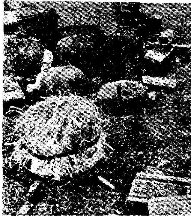
CIENTOS de cascos, armas y demás equipo fue abandonado por los soldados argentinos en Pradera del Ganso, en las Malvinas, al rendirse a las fuerzas británicas. La foto fue distribuida ayer por el Ministerio de Defensa inglés. (UPI)