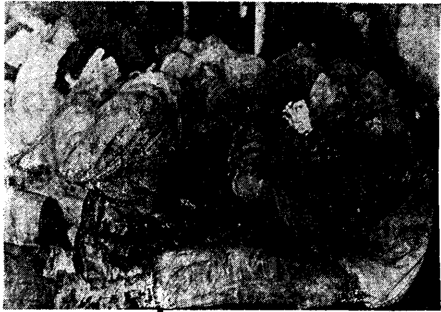
VARIOS PRISIONEROS argentinos, capturados por los británicos durante los ataques a Pradera del Ganso y Puerto Darwin, esperan a ser transferidos, en medio de un intenso frío, a un buque para ser repatriados.

En el archipiélago que debe reconquistar, el invierno y la nieve están ya presentes, con temperaturas debajo de 0 grados.