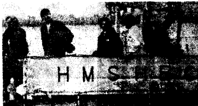
Ayer arribaron a Montevideo, Uruguay, algunos prisioneros de guerra argentinos. (AP)

El embajador británico dijo no saber nada de la posibilidad de que el gobierno de Estados Unidos pudiera participar con Gran Bretaña para gobernar las islas Falkland-Malvinas, aunque comentó "no es muy probable".