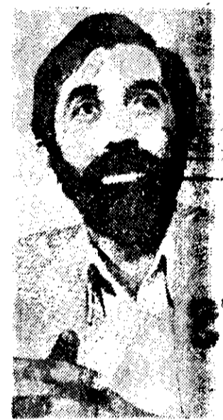
ALI AKBAR Velayati, ministro iraní de Relaciones Exteriores, manifestó ayer en La Habana, a donde asiste a la Reunión de Ministros de Relaciones Exteriores de los Países No Alineados, que Iran no descarta la posibilidad de incursionar militarmente en territorio iraní. (AP)

Desde que la oposición laborista arenó a la primera ministra Margaret Thatcher, casi al comienzo del conflicto, a producir "hechos, no palabras", ella se aseguró un abrumador apoyo una vez que las acciones bélicas dieron comienzo. El clima emocional británico fue comparable al de Estados Unidos durante la crisis de los rehenes en Irán. Hubo un elemento de nostalgia y descanso, en el hecho de que la nación podía unificarse ante un hecho ignominioso y ante el orgullo lastimado, a pesar de las múltiples querrelas particulares suscitadas aquí y allá. En una atmósfera así, no faltó quien se quejara de que algunas agencias informativas, en especial la BBC, propiedad del Estado, no dieron el apoyo moral necesario al país siendo demasiado "imparciales". Alguien incluso lanzó una acusación de traición, y la señora Thatcher se unió a esas voces. Pero, ¿qué otra cosa más importante tiene que defender un Estado democrático, que no está siendo realmente afectado en cuanto a su seguridad nacional, que el derecho de sus ciudadanos de conocer los hechos y ser informados honesta y oportunamente sobre una crisis que afecta a todos ellos? Los ataques contra la determinación de los responsables medios informativos británicos por ser objetivos, fueron considerados como enfermizos y sorprendentes.