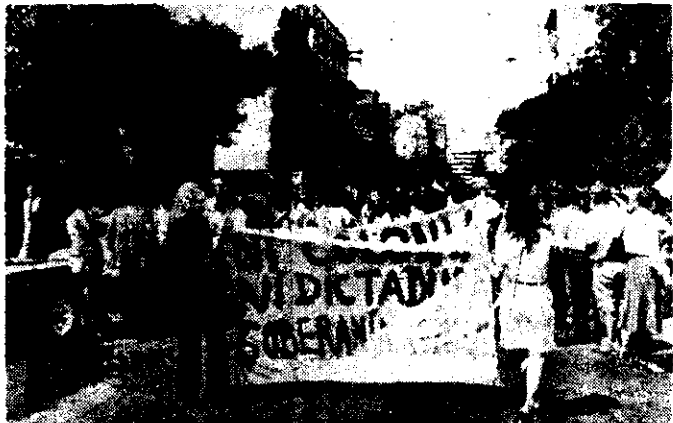
Residentes argentinos en México se concentraron ayer frente a la embajada británica en esta capital.

Mejía González manifestó asimismo que el simple apoyo moral de reconocer el reclamo argentino sobre la soberanía de las Malvinas por parte de México "deja mucho que desear y no responde a la tradicional actitud solidaria de México con los pueblos de América Latina".