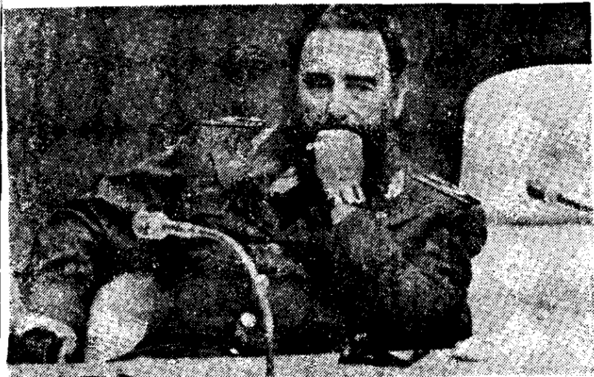
FIDEL CASTRO Ruz, durante la reunión ministerial del Buró de Coordinación del Movimiento de Países No Alineados celebrada ayer en La Habana.

Finalmente, recordó que en 1952 México sentó las bases del no armamentismo al rechazar la Ley de Asistencia Militar promulgada por Estados Unidos "que consistía en proporcionar armamento a los países que lo solicitaban, con la condición de instalar en ellos bases militares y defender el mundo occidental contra las acechanzas de los comunistas".