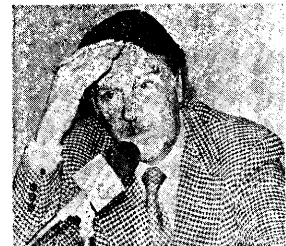
EL SECRETARIO de Relaciones Exteriores, Jorge Castañeda, hizo declaraciones a la prensa, a su retorno ayer, de Nueva York.

que existe contra los chilenos. Sin ir más lejos, una información proveniente de Bahía Blanca —a unos 600 kilómetros al sur de aquí— dio cuenta hoy que se ha detectado que los aviones Harrier y Sea Harrier británicos están utilizando misiles aire-tierra de procedencia norteamericana. De acuerdo con un portavoz naval, esos misiles poseen enorme versatilidad, capacidad de destrucción de aviones en combates tipo "pelea de perros" (combates aéreos máquina contra máquina, como en la II Guerra Mundial) y facilidad casi absoluta para disparos desde cualquier ángulo. "Por suerte —precisó el experto— son relativamente pocas las máquinas Harrier de los dos tipos indicados, dadas las enormes pérdidas que han experimentado". La furia antinorteamericana se acrecienta por momentos, al conocerse, asimismo, nuevas informaciones relativas al apoyo norteamericano a los ingleses. Se citó el caso de los aviones Sea Harrier que vuelan hasta las Malvinas desde la isla Ascensión, en las Georgias del Sur, a 2.000 kilómetros de distancia. Esos aviones van, bombardean y vuelven. Ello sería imposible, ya que tienen una autonomía de vuelo de sólo 750 kilómetros, si no fueran abastecidos en el aire por Hércules estadounidenses facilitados recientemente a Buenos Aires.