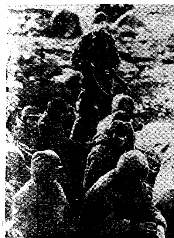
SOLDADOS argentinos capturados durante las acciones bélicas de Ganso Verde, en la isla de la Soledad, esperan ser devueltos a su país.