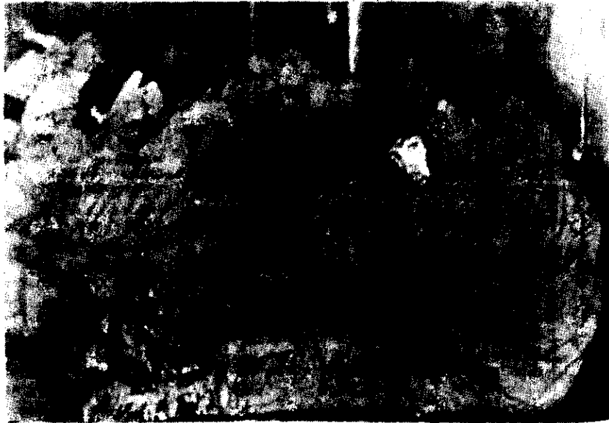
JOVENES SOLDADOS argentinos, prisioneros de las fuerzas inglesas, esperan en San Carlos para ser trasladados hacia otra zona. En el conflicto por las Malvinas, los británicos informaron que en Goose Green (Ganso Verde) y Darwin capturaron a unos mil soldados argentinos.

NUEVA YORK, 3 de junio (AP).— El diario The New York Times dice en un editorial publicado hoy que si bien "el respaldo de Estados Unidos a Gran Bretaña en la guerra de las Malvinas recibirá necesariamente una reacción negativa en América Latina, las versiones de que significará un calamitoso daño a las relaciones hemisféricas son pura tontería".