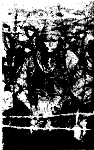
Soldados argentinos capturados en Goose Green y Darwin, permanecen en un campo de concentración en las islas Malvinas.