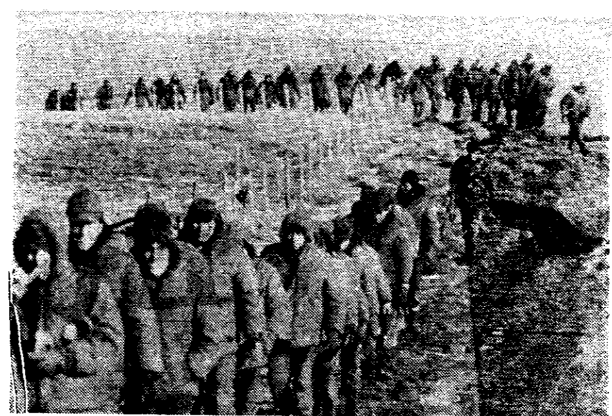
PRISIONEROS de guerra argentinos, camino de ser trasladados fuera de la zona de Pradera del Ganso, ayer en las islas Malvinas, infantes de Marina británicos los custodian.