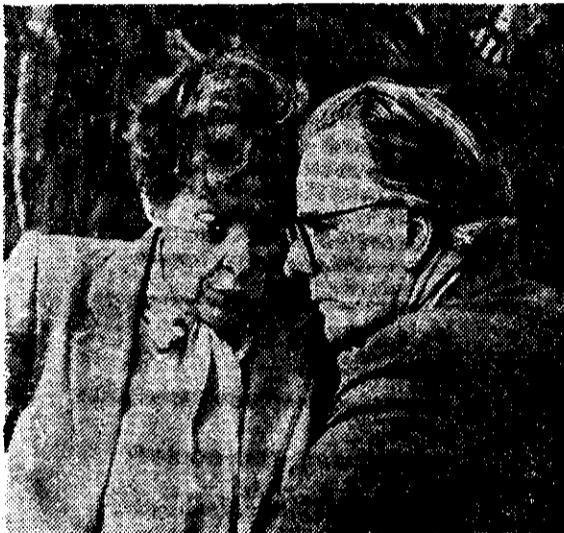
LOS EMBAJADORES de Estados Unidos y Gran Bretaña ante las Naciones Unidas, Jeane Kirkpatrick y Anthony Parsons, intercambian impresiones antes de iniciarse ayer la reunión del Consejo de Seguridad de la ONU sobre las Malvinas.

Sin embargo, los observadores en Washington estimaron que dicha relación es evidente, de confirmarse la información.