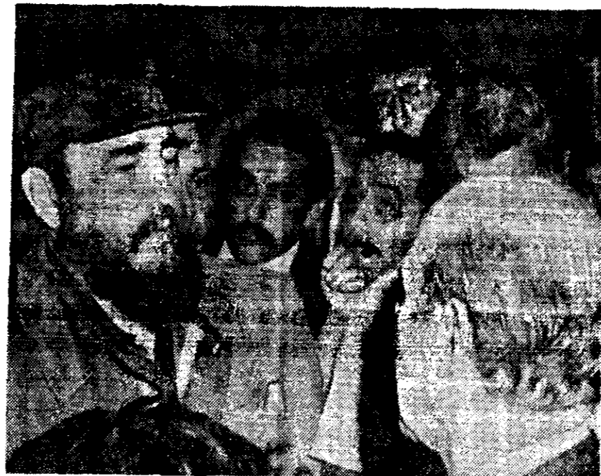
FIDEL CASTRO se encuentra con el canciller argentino Nicanor Costa Méndez en el Centro de Convenciones de La Habana, poco antes de que el representante bonaerense hablara ante la Junta de Ministros de los Países No Alineados.