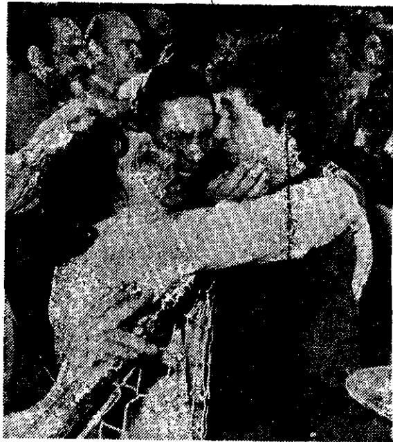
LOS PADRES de un sobreviviente del barco pesquero argentino Nerval, hundido por las fuerzas británicas en el Atlántico Sur, abrazan a su hijo al llegar éste a Buenos Aires.