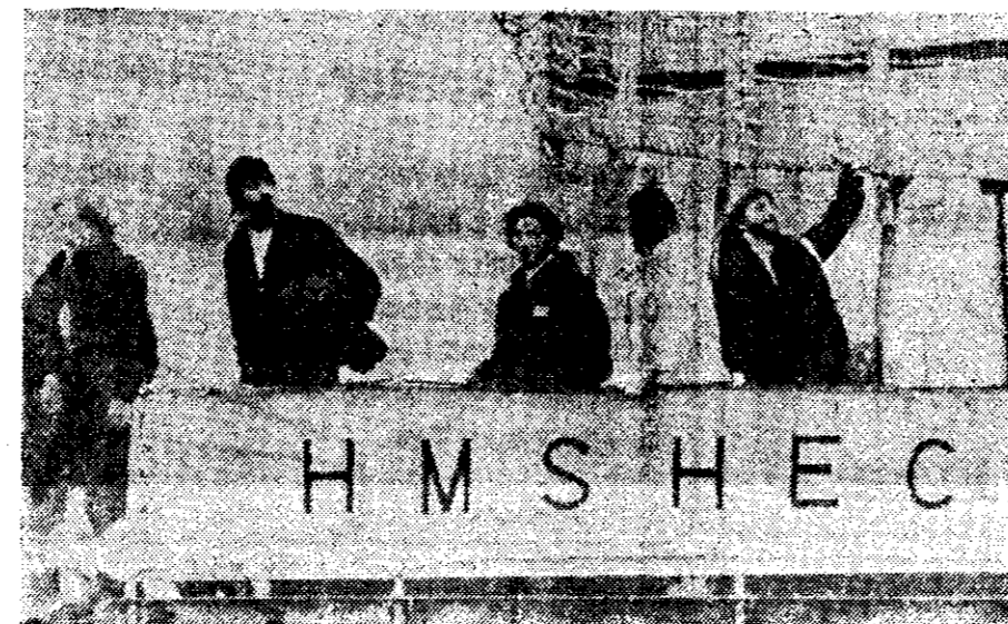
EX PRISIONEROS de guerra argentinos de la tripulación del buque Narval, capturado por los ingleses el 9 de mayo, desembarcaron ayer en Montevideo, de donde serán enviados a sus países.

El Ministerio de la Defensa, que había confirmado en Londres las informaciones que se referían a un almacenamiento de este producto por parte de los argentinos en las Malvinas, no confirmó, sin embargo, su utilización durante los combates, como habían señalado los medios de comunicación escrita de Gran Bretaña.