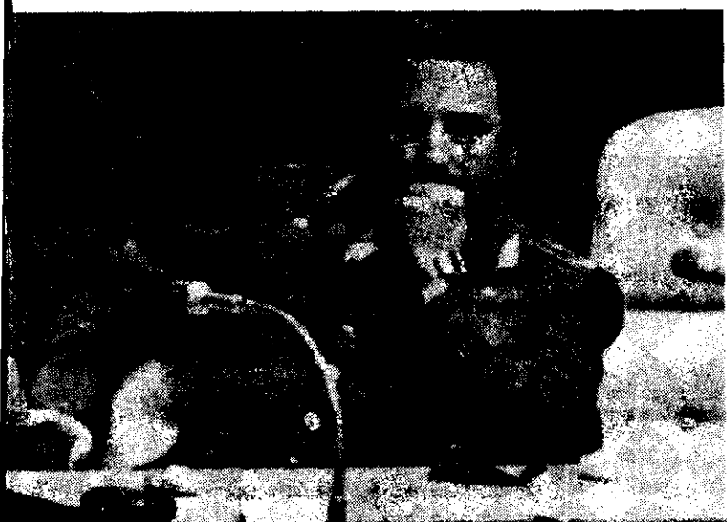
Fidel Castro, durante la sesión inaugural de la junta del Movimiento de Países No Alineados, en La Habana.

▷ Se inició la reunión de los No Alineados