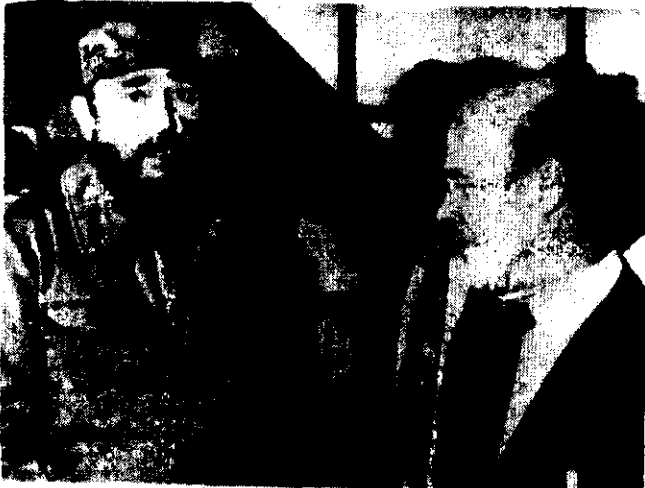
FIDEL CASTRO, presidente de Cuba y del Movimiento de Países No Alineados, se entrevistó con el canciller argentino, Nicanor Costa Méndez (derecha), quien llegó a La Habana para participar en la junta de la organización.

LA HABANA, 3 de junio.— El canciller argentino, Nicanor Costa Méndez, manifestó a los cancilleres de los Países No Alineados que su país no admitirá la instalación de bases militares en las Malvinas por parte de ninguna nación. Costa Méndez, que se entrevistó con el primer ministro cubano y presidente del Movimiento de los No Alineados, Fidel Castro, agradeció calurosamente el apoyo manifestado por esta organización a su país.